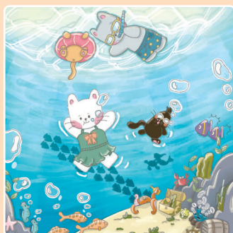
11 Лето на море