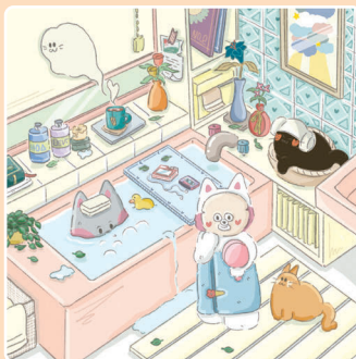
01 Банный день