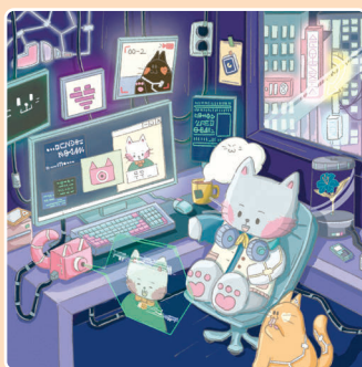
04 Фантазии о будущем