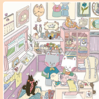
10 Мастерская Редьки