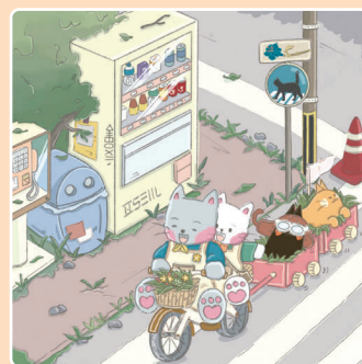
05 Быстрее, быстрее!