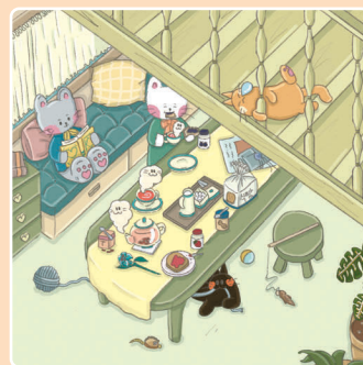
07 День лени