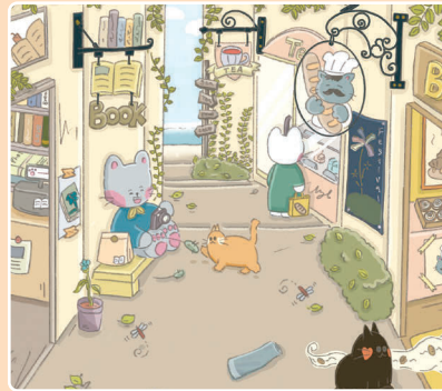
17 Прогулка Мяу-семейки