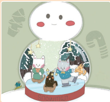
24 Снежный шар-снеговик