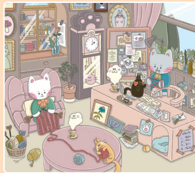
20 Заготовки на зиму