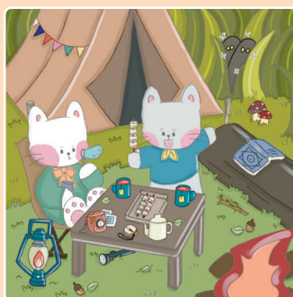
12 В походе