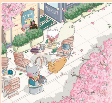
30 Любуемся цветением вишни