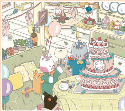
25 Тортик на день рождения Редьки