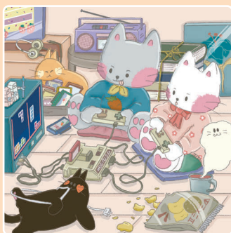
03 Время игр