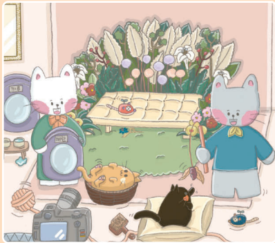
16 Фото на память