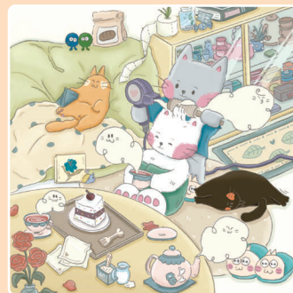
02 Заботливый Гречка