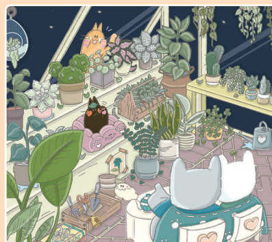
22 Любование звездами