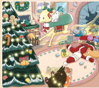
26 Аварийная посадка Санты