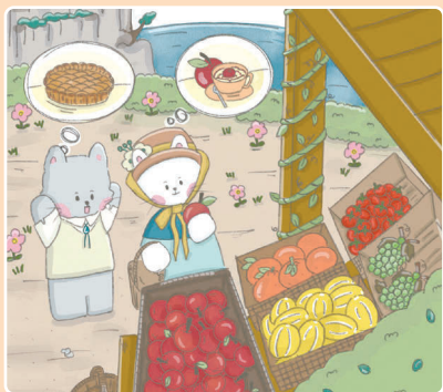
28 За продуктами!