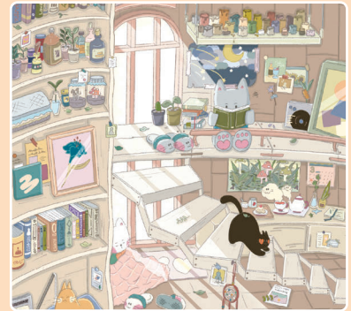
18 Тихий час