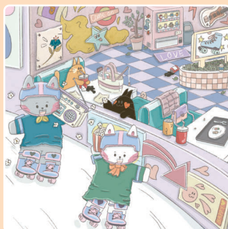
14 Катание на роликах