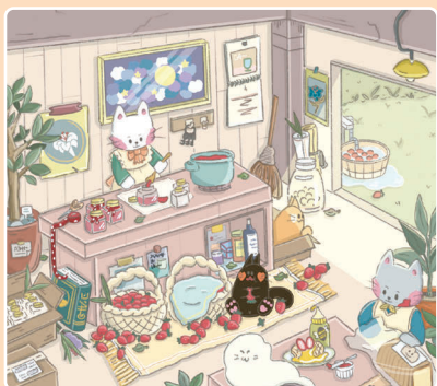
31 Готовим варенье