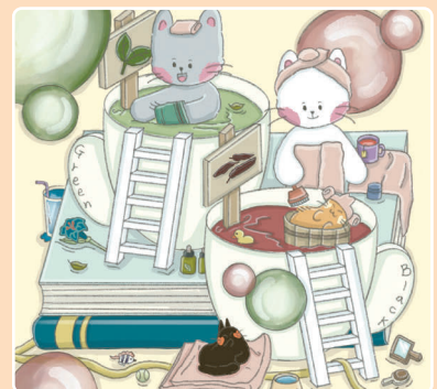
23 Горячие источники