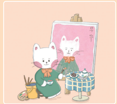
21 Автопортрет Редьки