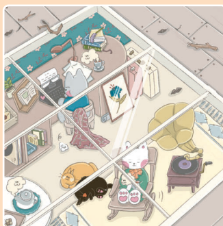
15 Чердак с видом на небо