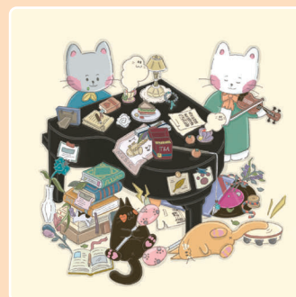
13 Концерт Гречки