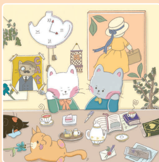
06 Время чаепития