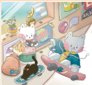
27 Катание на скейтах. Вжух!