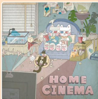
09 Вечер кино