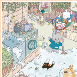
08 Стиральная машина сломалась...