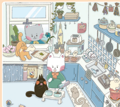
29 Готовка — это весело!