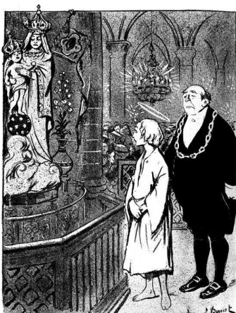
3. Эммуэль Барсе. Как Иисус провел Сочельник. Сатирический рисунок из журнала «Assiette au beurre» (21 декабря 1907 г.)

LE BÉBÉ JÉSUS. — C'est la Sainte Vierge... JÉSUS. — Pauvre maman ! Elle qui était si jeune !