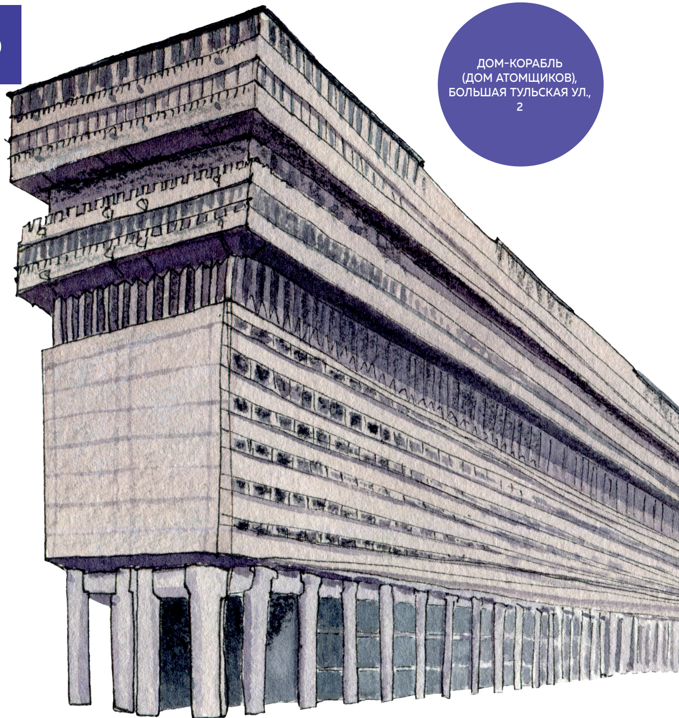
ДОМ-КОРАБЛЬ (ДОМ АТОМЩИКОВ), БОЛЬШАЯ ТУЛЬСКАЯ УЛ., 2