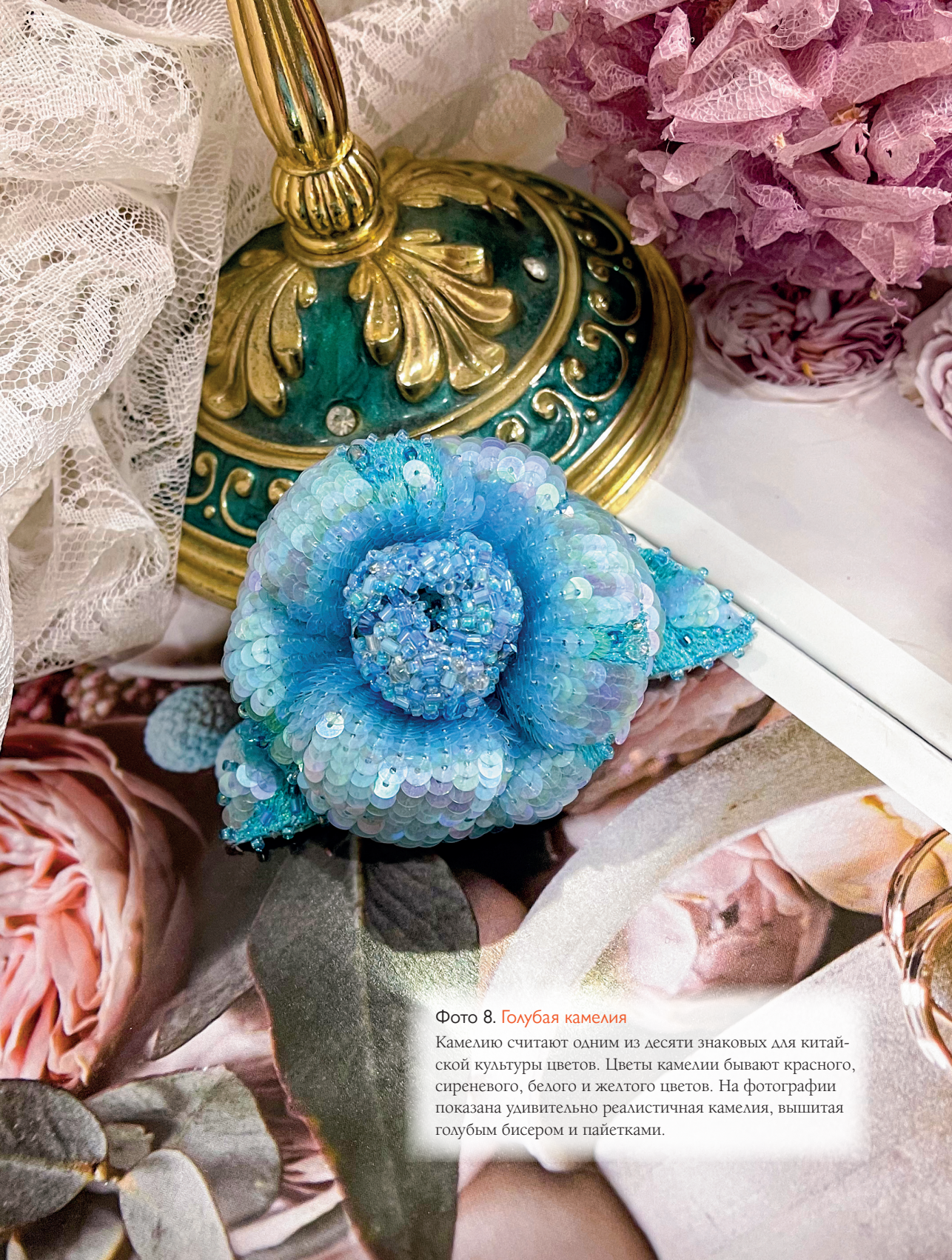
Фото 8. Голубая камелия

Камелию считают одним из десяти знаковых для китайской культуры цветов. Цветы камелии бывают красного, сиреневого, белого и желтого цветов. На фотографии показана удивительно реалистичная камелия, вышитая голубым бисером и пайетками.