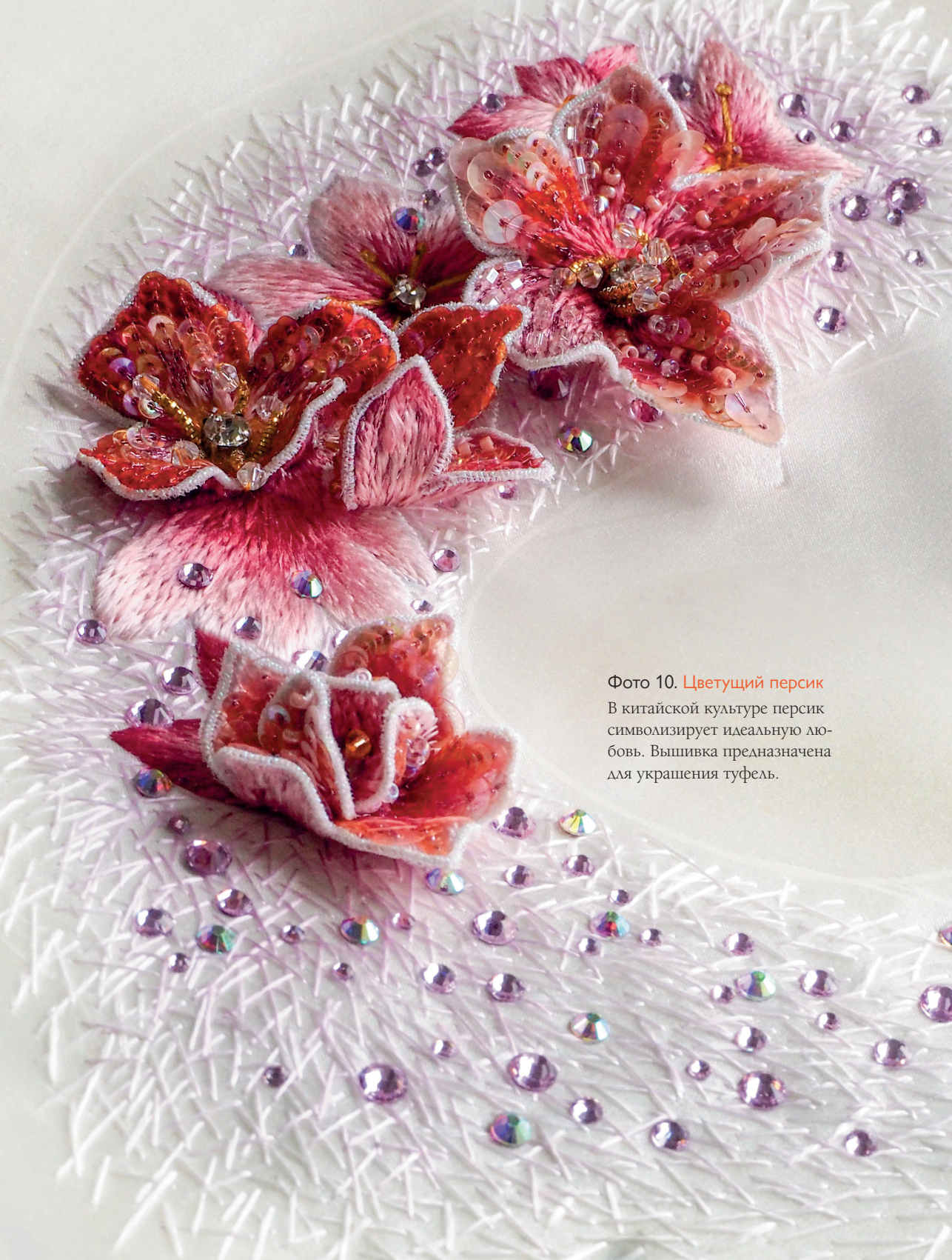
Фото 10. Цветущий персик

В китайской культуре персик символизирует идеальную любовь. Вышивка предназначена для украшения туфель.