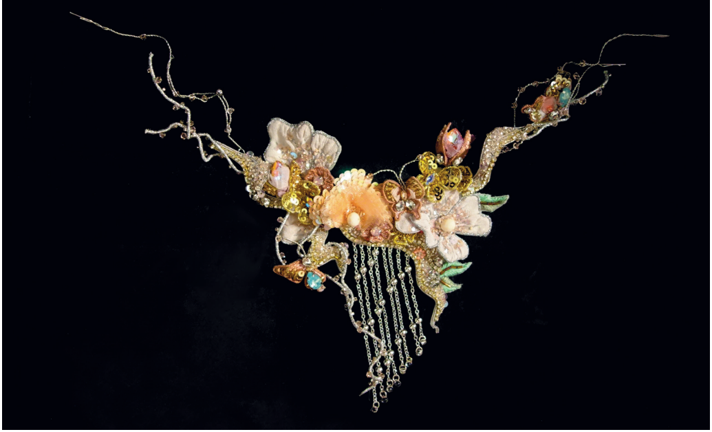
Фото 11. Цветочное ожерелье

Это ожерелье составлено из расшитых бисером цветов, бутонов и бабочек. Великолепный аксессуар для вечернего наряда.