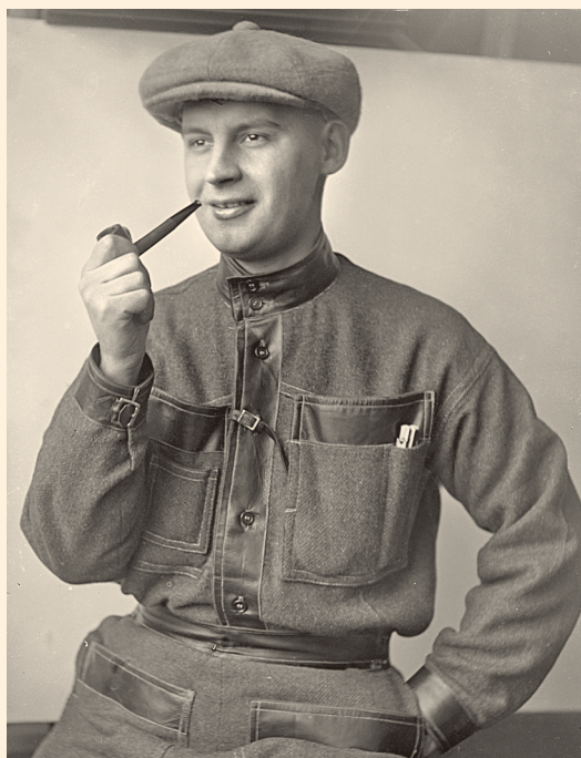
А. Родченко в производственном костюме, сшитом по его проекту Варварой Степановой. 1923–1924.

После переезда экспозиции в отреставрированное здание ГМИИ им. А. С. Пушкина в Кольчужном переулке, в этом же квартале, уже в 2014 году открылась выставка «В гостях у Родченко и Степановой». Снова и снова возникала тема «семейной формы» существования авангарда. Эта тема — не просто констатация факта совместной жизни двух художников. Возможно, она носит фундаментальный, онтологический характер: цельность, сила, действенность искусства рождаются в ситуации единства, понимания, содружества, помощи, эмоциональной поддержки, взаимного вдохновения.