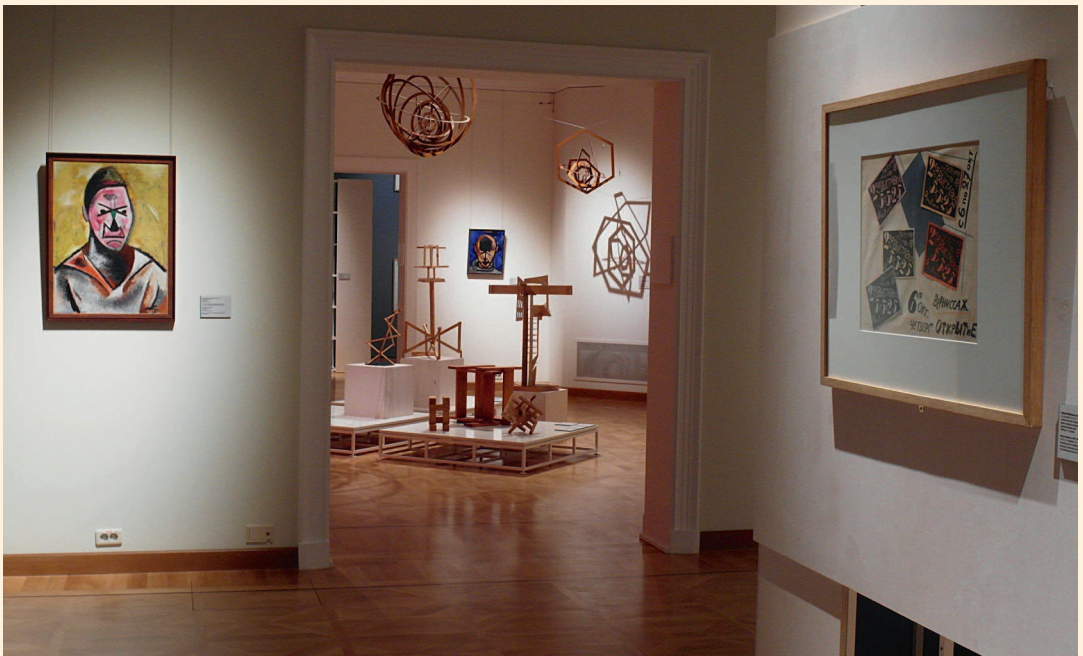
Фрагменты выставки «В гостях у Родченко и Степановой». Москва, ГМИИ им. А. С. Пушкина, 2014.