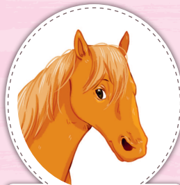
Чероки каурый жеребец