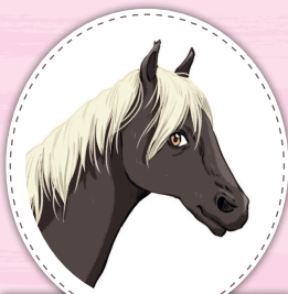
Буря чёрная лошадь с серебристой гривой