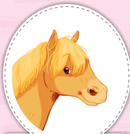
Вихрь фалабелла паломино