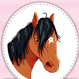
Кусака гнедая кобыла