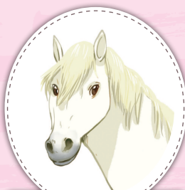
Астра камаргская кобыла