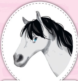
Меркурий конь серой масти