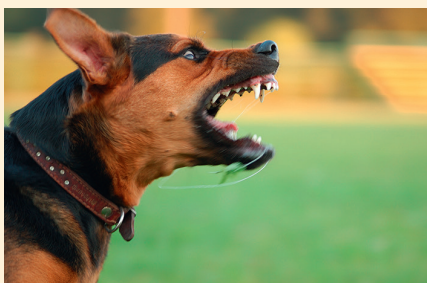
Устрашающая мимика при ворчании

Ворчание — еще один звуко- вой сигнал, который подается низ- ким голосом и означает агрессив- ное состояние, сопровождающееся отсутствием страха. При этом соба- ка не обязательно будет нападать на «противника», не вызывающего у нее симпатии и находящегося ря- дом. Пес его не боится и относится к объекту агрессии со своеобраз- ной высокомерностью. При таком поведении мимика собаки может воздействовать на «врага» сильнее самого ворчания.