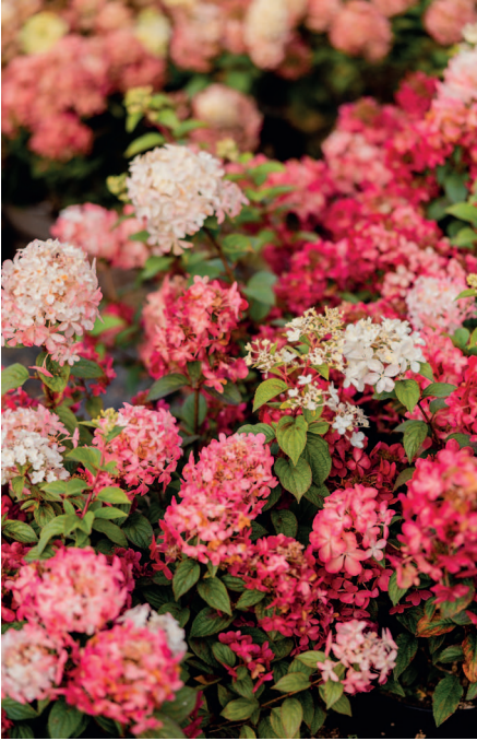
Гортензия метельчатая Петит Стар

Формирующая обрезка. Вот тут и начинается настоящая магия. Вы только представьте, какие шедевры вы можете создать в своем саду. Думаю, что вы мне скажете, что этому надо специально учиться, но это не так. Мы с вами садоводы и создаем сад по нашему вкусу, мы не занимаемся общественными парками и скверами, а обустроиваем свой загородный участок для души. Есть множество кустарников, которые скажут вам спасибо за сделанную им «прическу». Например, дерен или пузыреплодник от стрижки будут расти еще лучше, и даже если вы по неопытности срежете что-то лишнее, они никогда не будут страдать, а прекрасно нарастят новые побеги. Открою вам маленькую тайну: именно на дерене я тренировалась