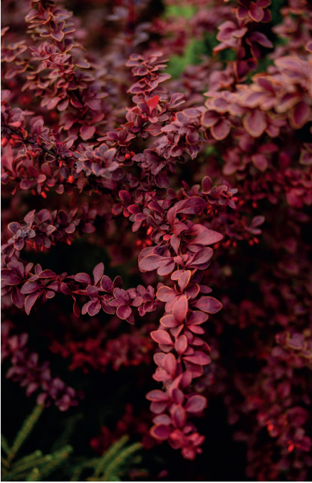
Барбарис Тунберга Голден Ринг

Кустарники можно использовать в различных композициях, делать живые изгороди разной высоты, которые регулируются стрижкой или же подбором сортов нужного размера. Дальше я поделюсь с вами оригинальными вариантами бордюров, которые можно делать вдоль дорожек или вдоль цветников. Очень интересное решение — использовать кустарники как способ маскировки различных предметов, которые очень нужны на участке, но при этом портят вид. Об этом я также с удовольствием расскажу вам.