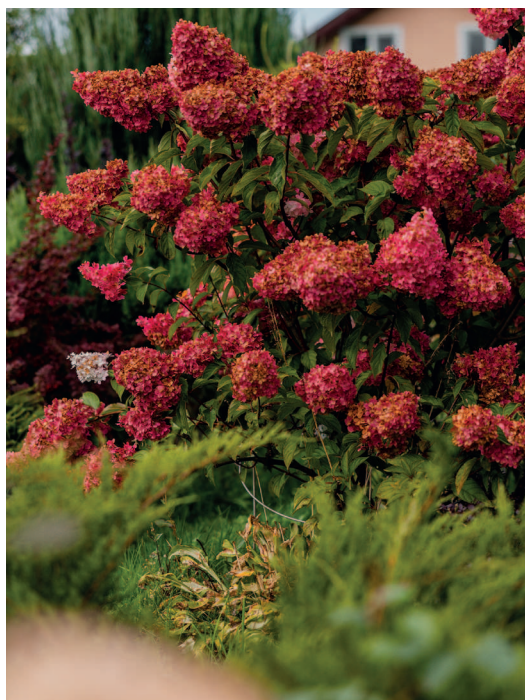
Гортензия метельчатая Ваниль Фреиз

Санитарная обрезка. Я провожу ее каждую весну и советую делать так всем, ведь после зимы растения могут выйти со сломанными ветками, где-то поврежденными снегом, настом или грызунами. Если не проводить такую обрезку, растения будут постепенно терять свой декоративный вид, могут начать развиваться болезни. Пройти с секатором раз в сезон и удалить поврежденные побеги проще простого и точно не страшно, вреда кустарникам от этого не будет.