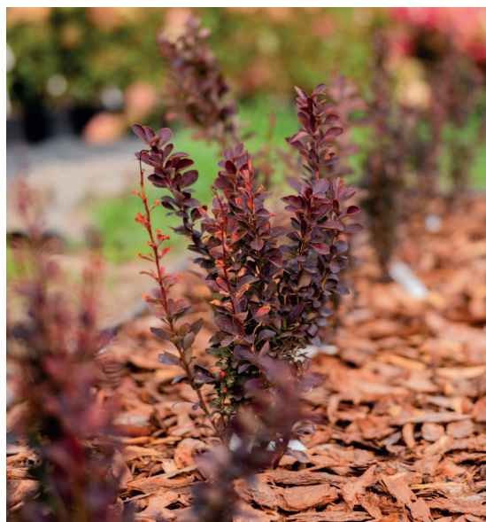
Молодая живая изгородь из барбариса Тунберга Ред Рокет

Кустарники, какого бы вида и сорта они ни были, по своей сути очень просты в уходе. Сейчас несложно выбрать кустарник для своего сада, который будет расти и радовать, а усилий вкладывать придется в разы меньше, чем, на-