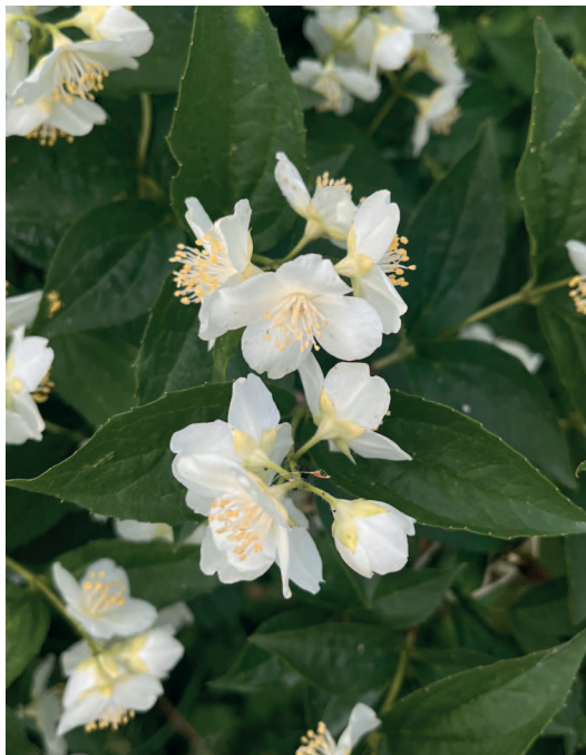
Цветущий чубушник весной

А знаете ли вы, что плотная живая изгородь уменьшает уровень шума ? Если посадить ряд растений, который в дальнейшем станет живой стеной, то уровень шума машин, соседей, дороги значительно снизится. Это еще одна замечательная функция кустарников в саду.