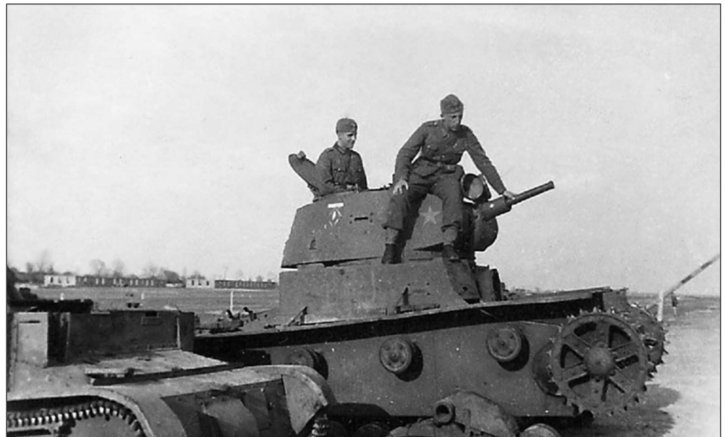
Оставленные в парке 67-го тп в Грудеке-Ягеллонском Т-26 обр.38 г. и танкетка Т-27

Из состава дислоцировавшегося в Судовой Вишне 68-го тп были оставлены неисправными 3 Т-35 и 2 линейных Т-26. Еще 6 двухбашенных Т-26, все имевшиеся в полку, были оставлены по причине отсутствия экипажей, так же как и 10 Т-27. Впоследствии они были подорваны при отходе. Однако несколько двухбашенных танков были оставлены исправными и использовались в качестве движущихся мишеней подразделениями 5-й тд вермахта