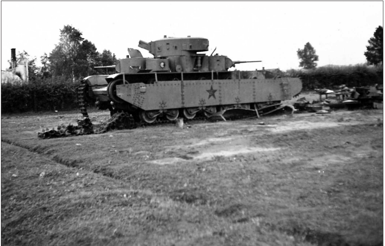
Оставленный в Судовой Вишне неисправный Т-35 68-го тп

68-й тп: 31 Т-35, 116 Т-26 (40 радиийных, 6 двухбашенных), 19 ХТ-26, 1 ХТ-130, 7 ХТ-133, 1 Т-26 тягач, 10 Т-27, 2 БА-10, 6 БА-20. Фактически в полку числилось 122 Т-26, но 6 машин (2 радиийных, 2 линейных и 2 двухбашенных) были еще до мая 1941 г. отправлены на рембазу для прохождения капремонта.