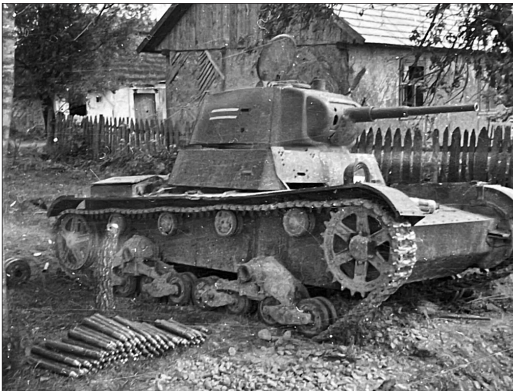
На стр. 17–18: Т-26 68-го тп, оставленный 23–24 июня из-за поломки в районе Судова Вишня — Грудек Ягеллон- ский