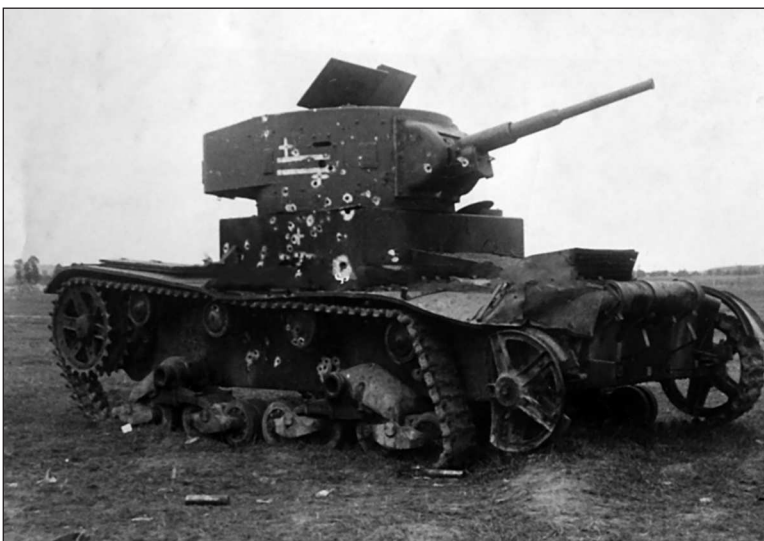
Тот же танк после обстрела немецкими артиллеристами в конце июля 1941 г.

Белички голова колонны 67-го тп подошла к 23.45, и маловероятно, что разведрота немедленно получила приказ вести разведку в направлении границы. Впрочем, не исключено, что дата потери указана ошибочно, как в случае с ХТ-26 68-го тп, проходящим по акту как уничтоженный в бою в районе Вербы 24 июня, за три дня до того, как подразделения полка впервые появились в том районе.