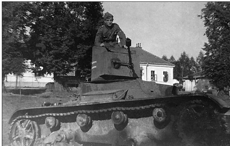
Один из двух полкомавшихся на марше и оставленных в Грудеке Ягеллонском 24 июня 1941 г. ХТ-26 из 4-го (огнеметного) батальона 68-го тп

67-й тп, возможно, был первой частью дивизии понесшей потери уже в первый день войны. Три БА-10 и одна ФАИ полковой разведроты числятся выведенными в бой 22 июня лейтенантом Сушкиным и не вернувшимися по неизвестным причинам. Правда, совершенно непонятно, в какой бой были выведены бронемашин разведроты, от Грудека, где дислоцировался полк, до границы без малого 60 километров, а в район сосредоточения у фл.