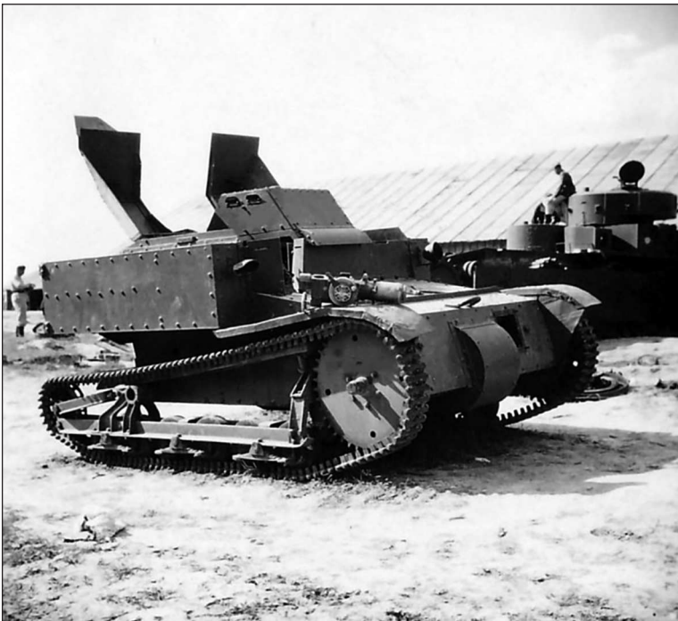
Танкетка Т-27, оставленная в парке 67-го тп в Грудеке Ягеллонском. На заднем плане Т-35