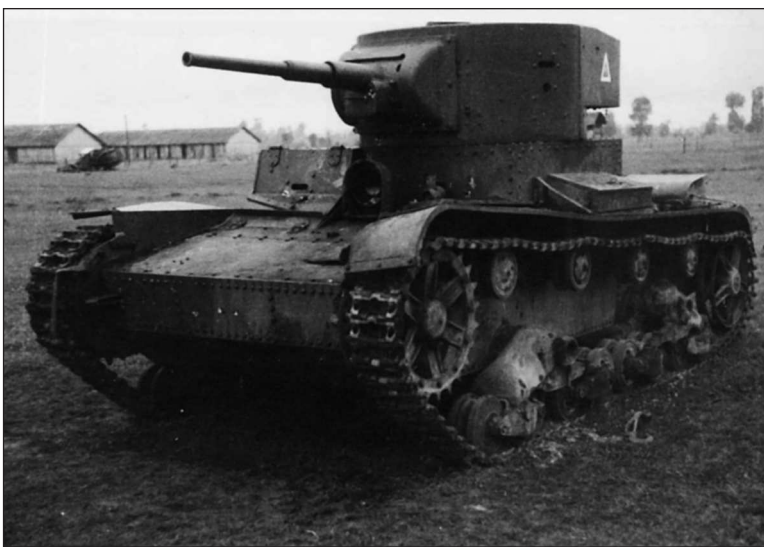
Линейный Т-26 из состава 68-го тп, оставленный в Судовой Вишне

Утром 29 февраля 3-я рота 1-го тб совместно с 3-м батальоном 169-го сп атаковала финнов на рубеже Майсалакери. Не имевшая средств пто финская пехота бежала, теряя убитых и раненых. К 18.00 не понесшая потерь рота вернулась на исходные позиции.