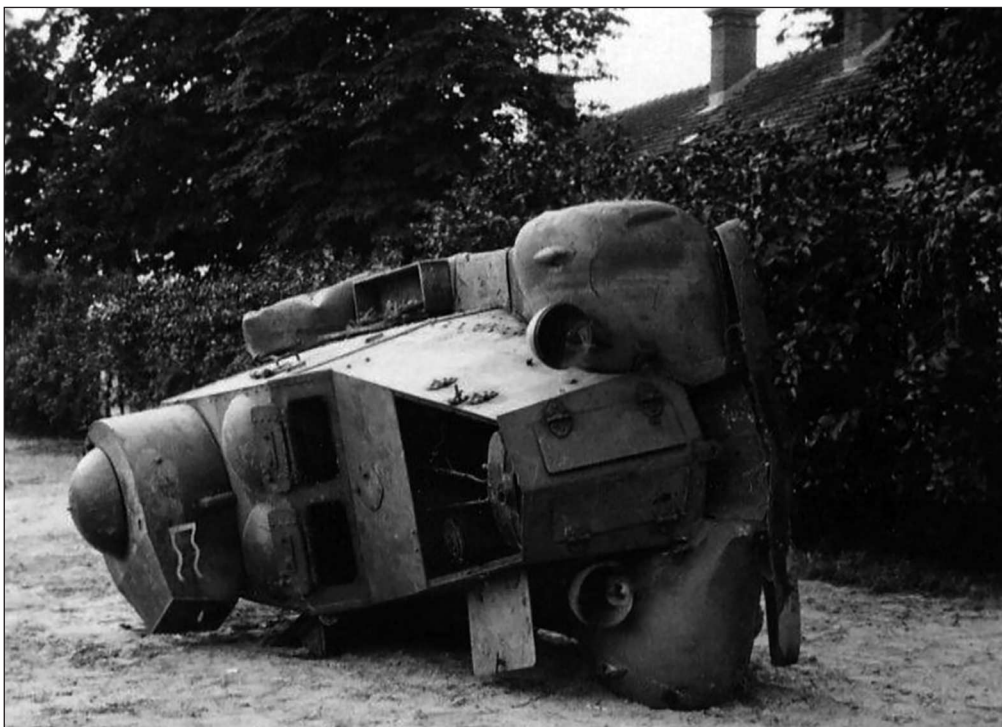
ФАИ из состава 34-го обс 34-й тд, оставленный 22 июня в Грудеке Ягеллонском

В первой половине июня некоторые подразделения 68-го тп были выведены в летние лагеря, как с матчастью, так и без неё. Так, например, 3 июня, во время проведения учебной тревоги, находился в лагере (без матчасти) 4-й тб полка. А по данным немецкой авиаразведки, вторгавшейся в воздушное пространство СССР 2, 10 и 12 июня, в лесу возле Судовой Вишни (число не указано, донесение сводное, по результатам всех разведывательных полётов первой половины июня) обнаружены танки, до 60 автомашин, трактора и артиллерия. Вероятно, часть подразделений 67-го тп также выводилась в лагеря. По расположению частей дивизии на вечер 21 июня данных нет.