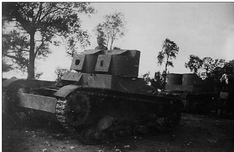
Двухбашенные Т-26 со снятым вооружением, оставленные в парке Грудека 67-го тп в Ягеллонском

Информация из жбд не сходится с данными составленных 18.07.1941 в г. Нежин актов о потерях матчасти частей 34-й тд. Так, например, оставленными в пунктах постоянной дислокации в актах указаны 6 Т-35, находившихся в среднем ремонте, а согласно жбд количество выведенных дивизией «тридцатьпятых» на десятку меньше числа имевшихся. Правда, два Т-35 68-го полка в нежинском акте числятся застрявшими в болоте возле Судовой Вишни без указания даты. Также не указана дата потери в акте на Т-35 67-го тп, у которого был сожжен бортовой фрикцион в районе Грудека. Вероятно, при выводе подразделений из пунктов постоянной дислокации в районы сбора несколько машин вышли из строя по техническим причинам или застряли в болоте.