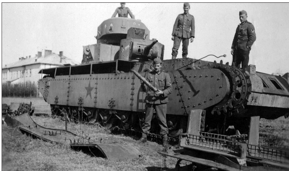
Оставленный в Судовой Вишне находившийся в ремонте Т-35 из состава 68-го тп