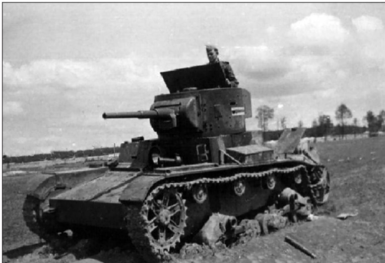
Радийный Т-26 № 663 из состава 68-го тп, оставленный в Судовой Вишне с разбитым ленивцем