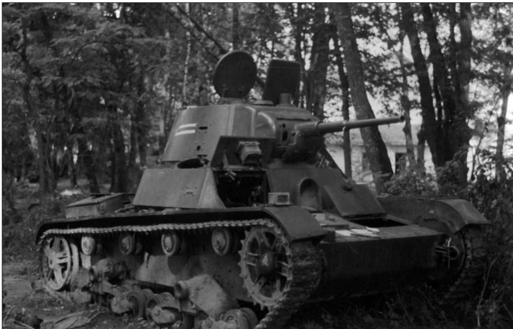
Т-26 из состава 68-го тп, оставленный из-за поломки в районе г. Броды

В обстоятельствах потери еще одного, вероятно также поврежденного 24 июня, Т-26 из 68-го тп указано: «Т-26 рад(ийный) 663. Разбит ленивец, оставлен в районе С. Вишня, пушка приведена в негодность, пулемет и оптика с машины сняты. 26.6.41 г.» Впоследствии этот танк,