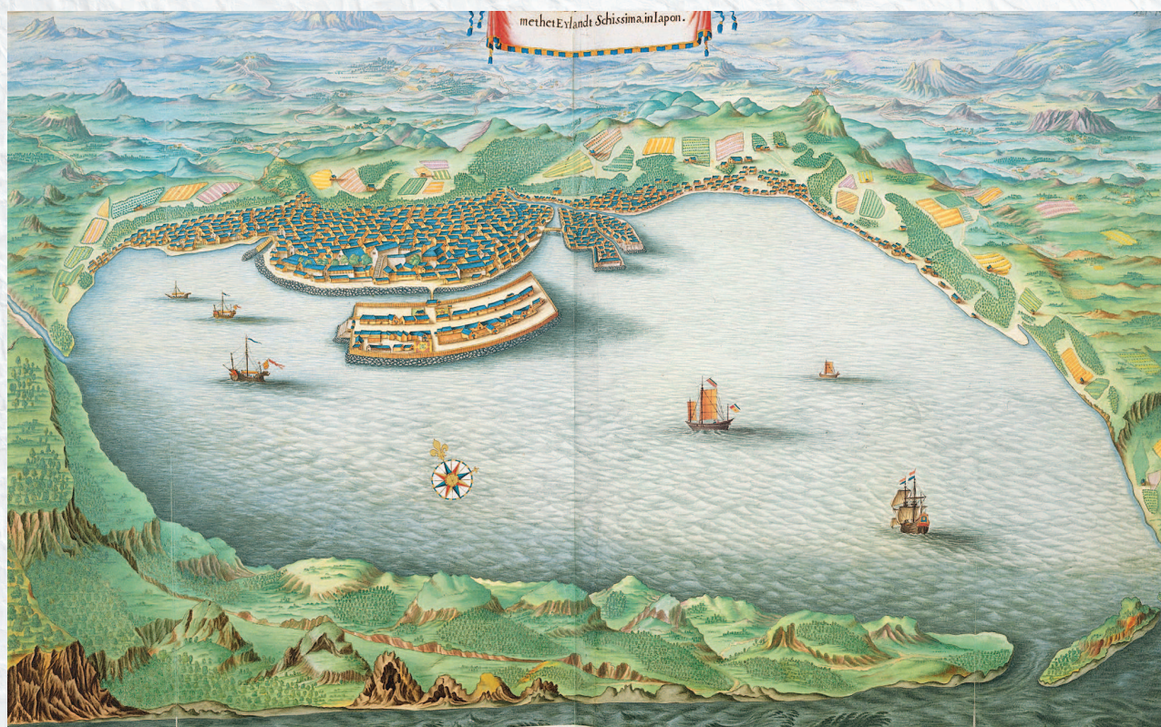
▲ Островок Дэдзима. Гравюра

открыли заговор, ни то, что они сотрудничали с войсками императора в Симабаре, — не помогло ничего. Более того, то, как повели себя голландцы по отношению к другим христианам, в конце концов, было оценено как недостойное и вызывающее беспокойство поведение. Трудно было поверить, что народ, который принял участие в кровопролитии огромного количества своих единоверцев, будет себя вести честно с иностранным государством, которое он считает языческим. Голландцы добились только того, что они посеяли недоверие японских властей по отношению вообще ко всем иностранцам. Поэтому в 1641 г. голландцы по приказу по-