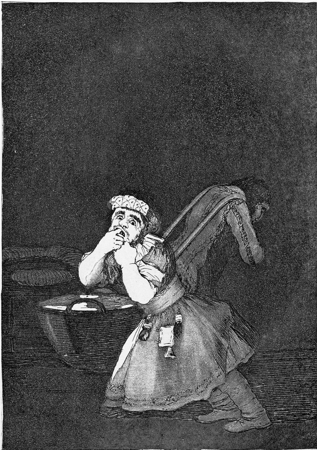
El de la rollona.