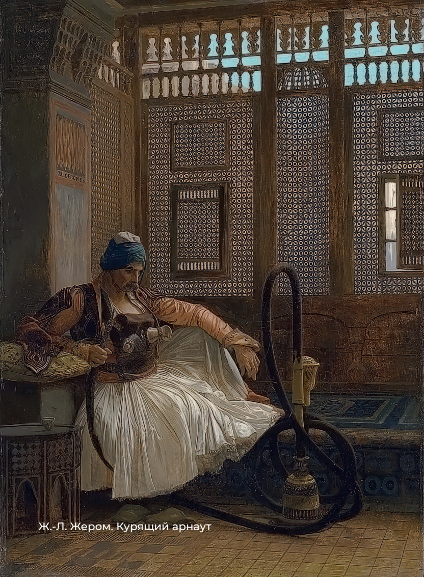
Ж.-Л. Жером. Курящий арнаут