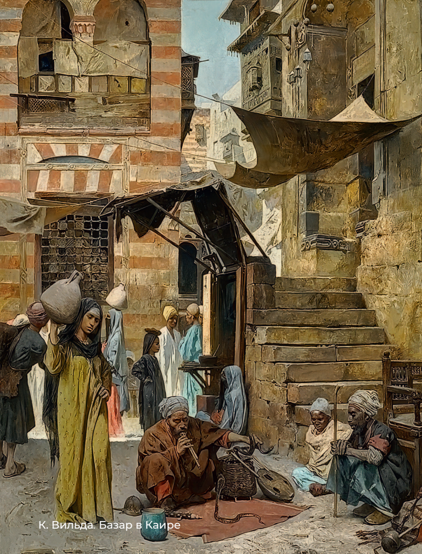
К. Вильда. Базар в Каире