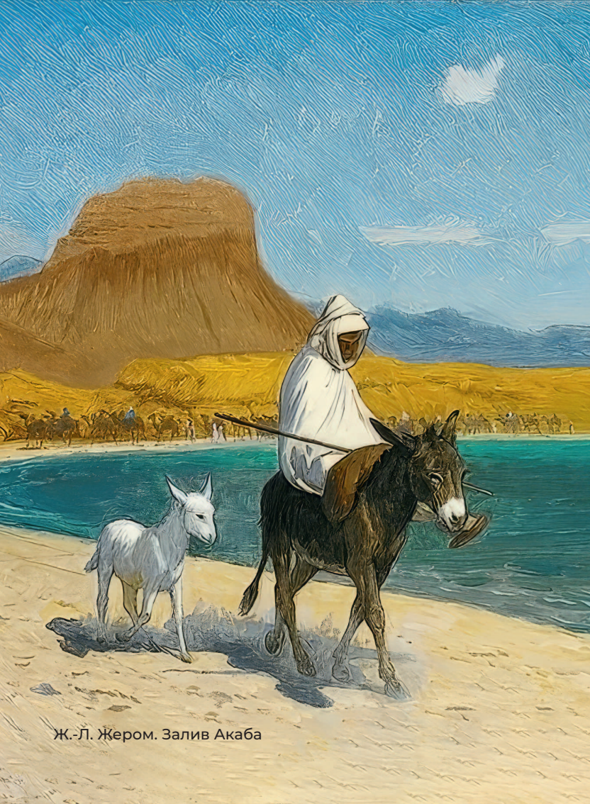
Ж.-Л. Жером. Залив Акаба