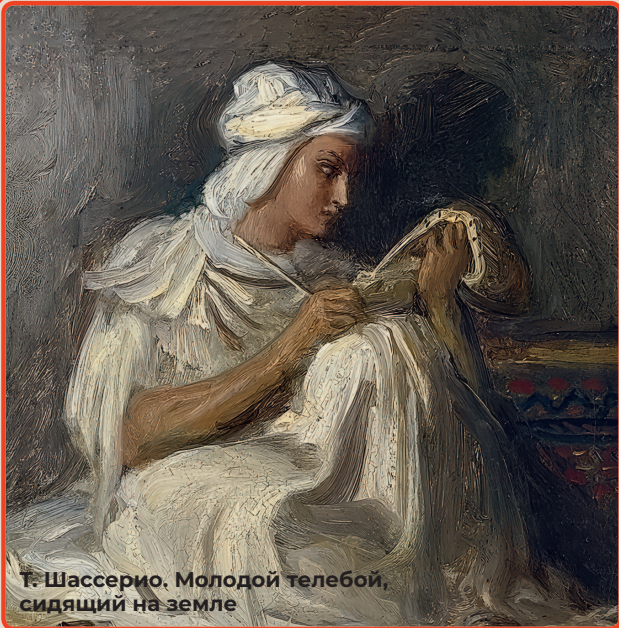
Т. Шассерио. Молодой телебой, сидящий на земле