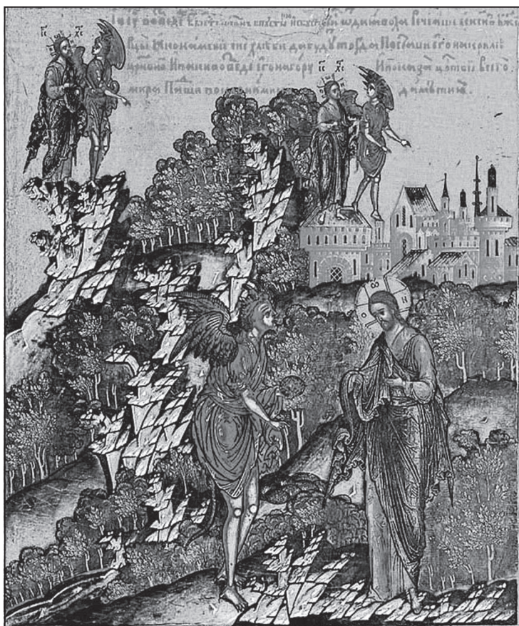
Искушение Христа. Клеймо иконы Спас Вседержитель. 1682. Симеон Холмогорец

хлебом». На что Иисус отвечал: «Написано, что не хлебом одним будет жить человек, но всяким словом, исходящим из уст Божиих». Дьявол возвел Его на высокую гору и показал вся царствия вселенной во мгновение времени: «Тебе дам власть над всеми сими царствами и славу их, ибо она передана мне, и я, кому