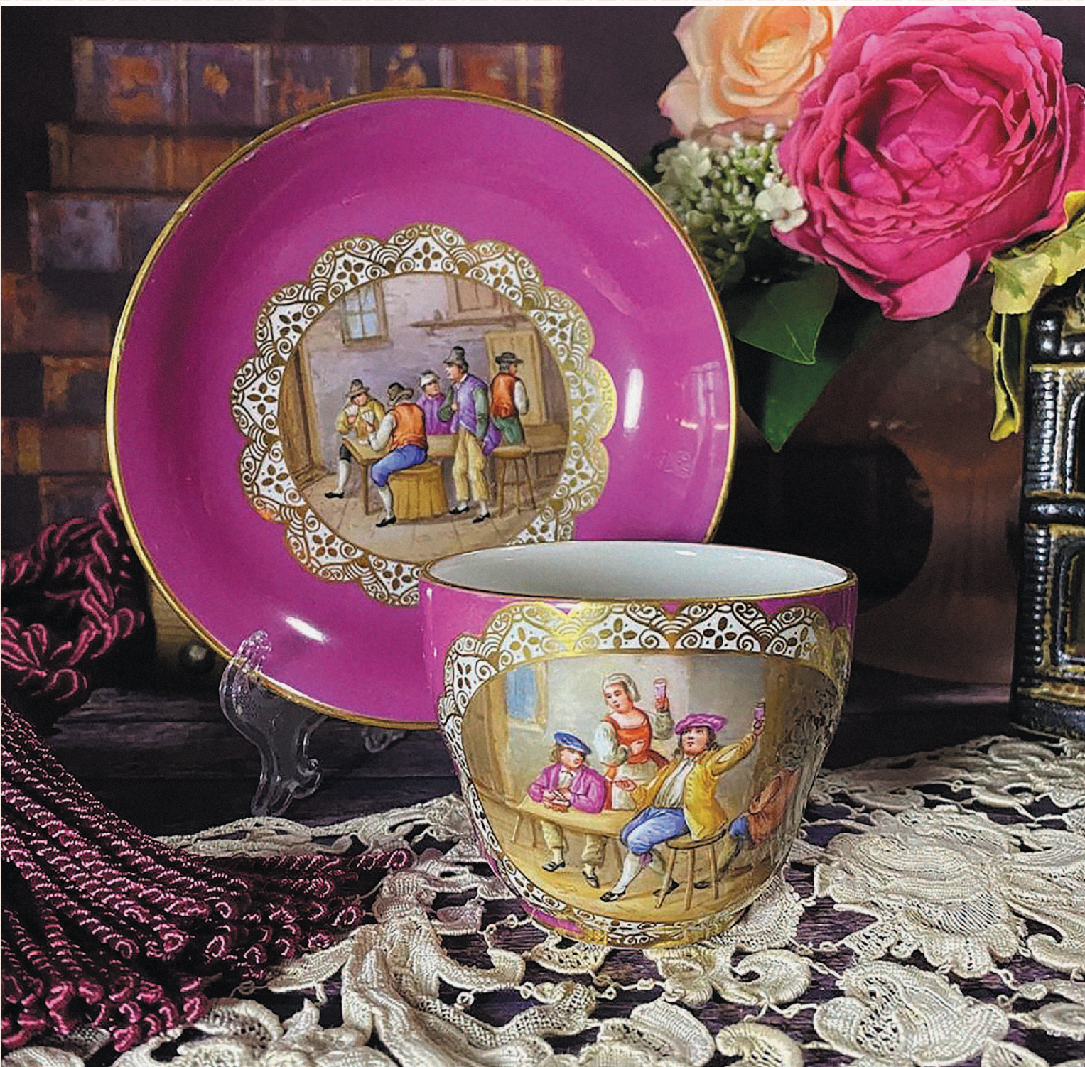
Китайское искусство на европейской почве: немецкая чайная пара мануфактуры Ansbach (Ансбах-Брукберг). Конец XVIII Века