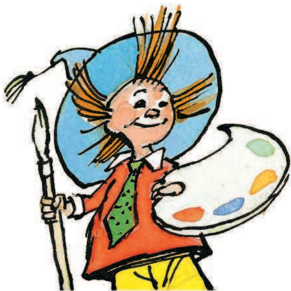
Рисунки И. Семёнова