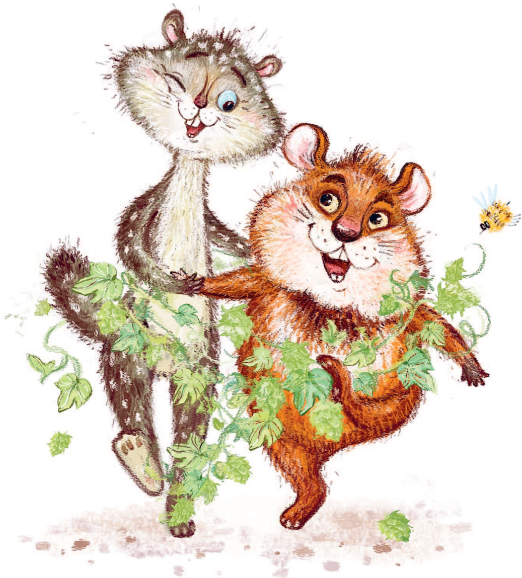
Рисунки Е. Гершуни