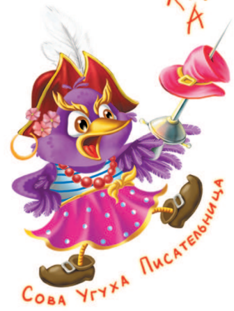
СОВА УГУХА ПИСАТЕЛЬНИЦА