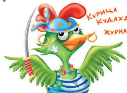
КУРИЦА КУДАХА ЖУРНАЛИСТ