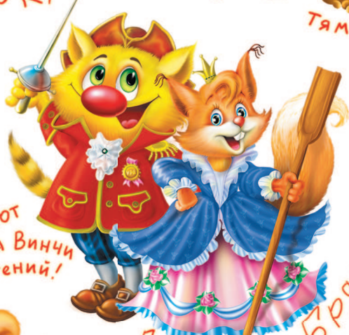
КОТ ДА Винчи гений!