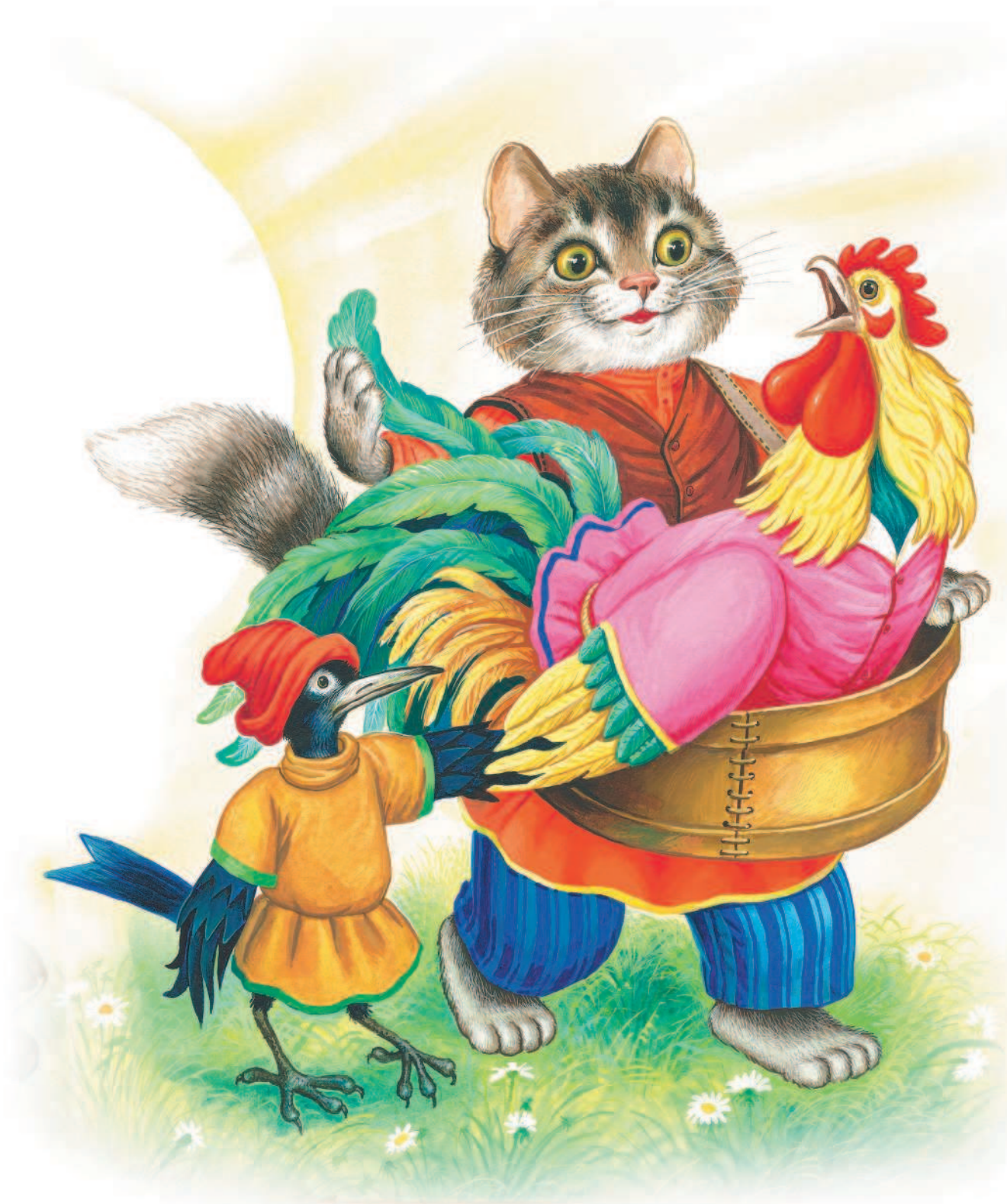
Рисунки И. Цыганкова