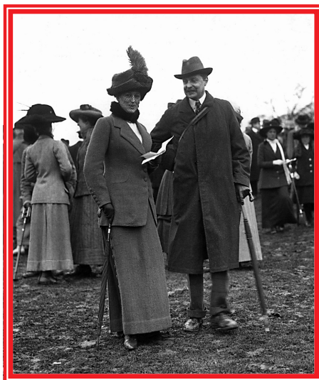
Джордж Корнуэллис-Уэст. 1912 г.

Отважный капитан был старше ее сына, Уинстона Черчилля — который родился в 1874 году, 30 ноября, — всего на 16 дней. Это нуждается в некоторых комментариях.