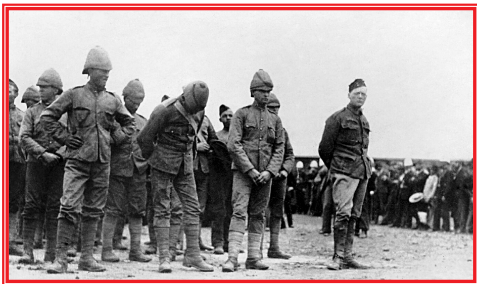
Уинстон Черчилль (крайний справа) в плену у буров, 1899 г.

К неполным 26 годам Уинстона уже немало поносило по свету: в качестве военного корреспондента он побывал на Кубе, в качестве лейтенанта гусарского полка успел повоевать в Индии, в качестве сверхштатного офицера уланского полка — в Судане, а вот сейчас возвращался после сенсационного побега из плена, куда он угодил во время бурской войны. Буры с его статусом представителя прессы не посчита-