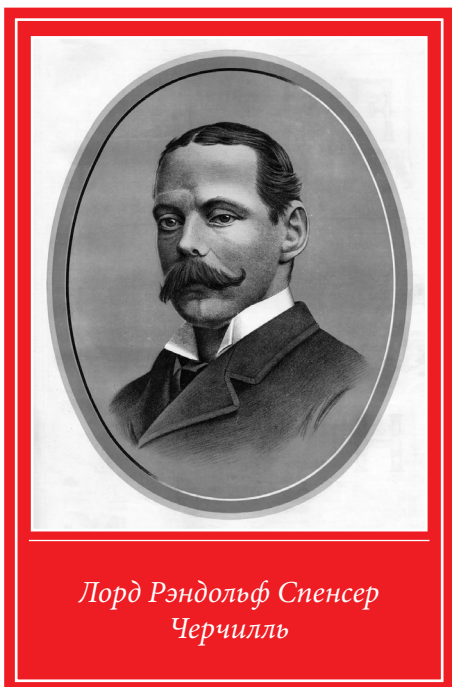
Лорд Рэндольф Спенсер Черчилль

Наверное, наиболее точным определением леди Черчилль было бы «веселая вдова» — в духе оперетты Ференца Легара, которая так и называлась. Беда была только в том, что в 1900 году до написания оперетты оставалось еще 5 лет, и если «вдовой»