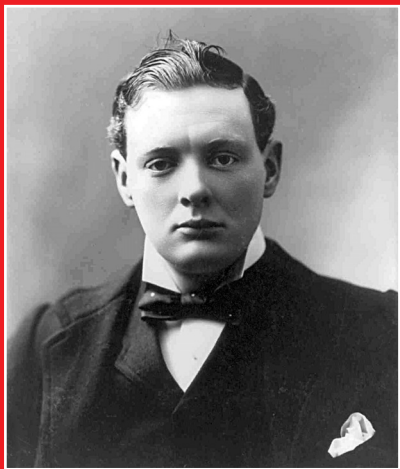
Уинстон Черчилль в 1900 г.

вернулся на войну, сумел получить лейтенантский чин в Южноафриканском полку легкой кавалерии, в числе первых ворвался в завое-