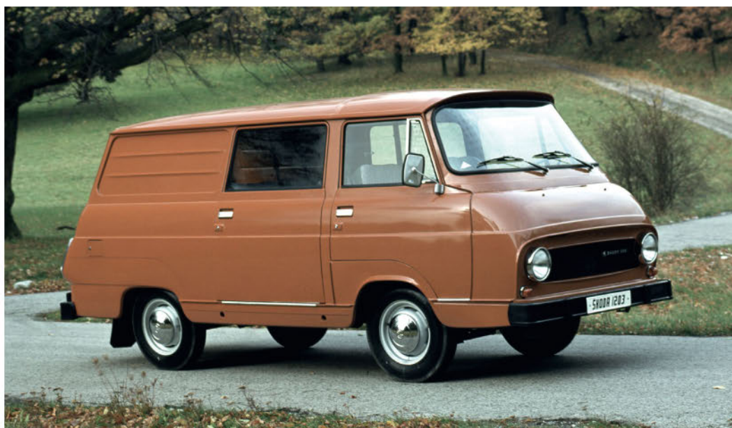
← Восточная Европа выпустила несколько стильных фургончиков – таких как эта Škoda 1203 (Škoda)

■ Что делать, если ваша Škoda окружена роем злых пчел? Перестать толкать машину и спрятаться в салоне.