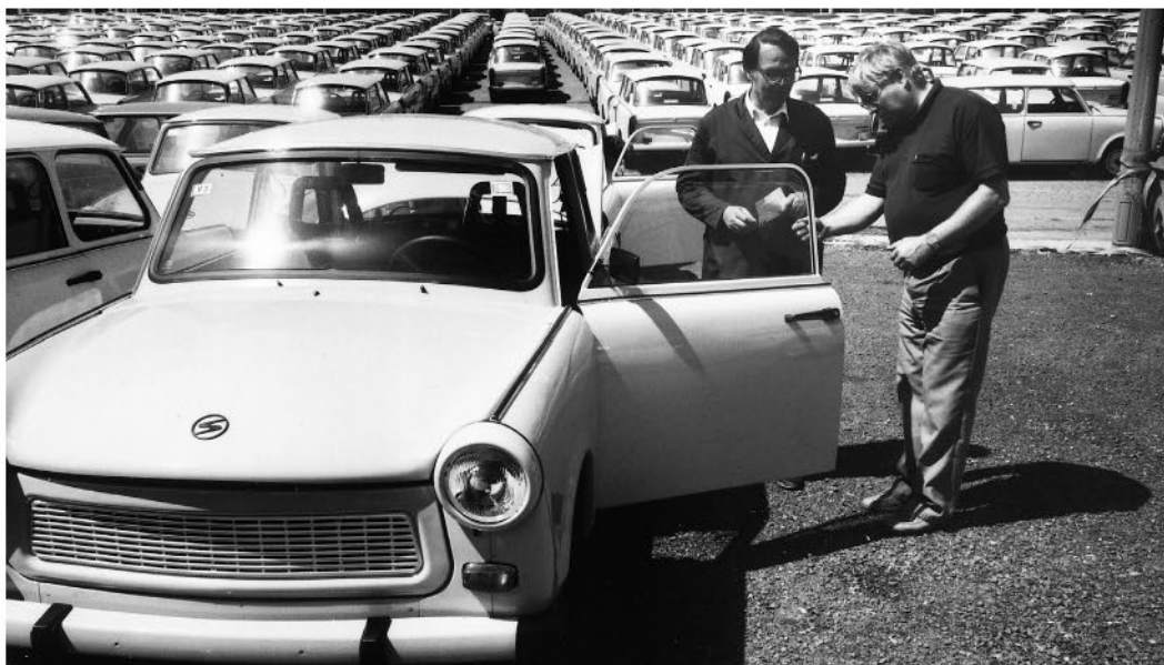
← Редкий кадр для Восточной Германии – получение ключей от нового Trabant. Очереди в то время могли достигать 10 лет

мость Škoda или Wartburg с ценой на внутреннем рынке, это именно так и выглядело. Однако занижение цен категорически отрицали как западные импортеры, так и сами восточные производители. Наоборот, цены искусственно завышали на внутренних рынках, чтобы ограничить народный спрос, – интересное использование капиталистических методов в социалистическом обществе! Более того, можно сказать, что в странах Восточного блока практически не существовала инфляция. На некоторых запчастях для Trabant цена была выбита вместе с номером детали. Конечно, в 1970-х годах, когда годовая инфляция в таких странах, как Великобритания, превысила 26 %, и британские производители каждые три месяца регулярно повышали свои цены, это был весомый аргумент. Бесспорно, восточные автомобили тех лет идеально подходили неимущим британским водителям. В журнале What Car? в июле 1976 года писали, что «восточноевропейские машины в целом могут и не обладать изяществом или харизмой европейских и японских продуктов. Но у них настолько хороши цена и комплектация, что покупателю не найти другой новой машины по такой цене. И если ему не нравится авто из Восточной Европы, то придется покупать довольно старый подержанный автомобиль».