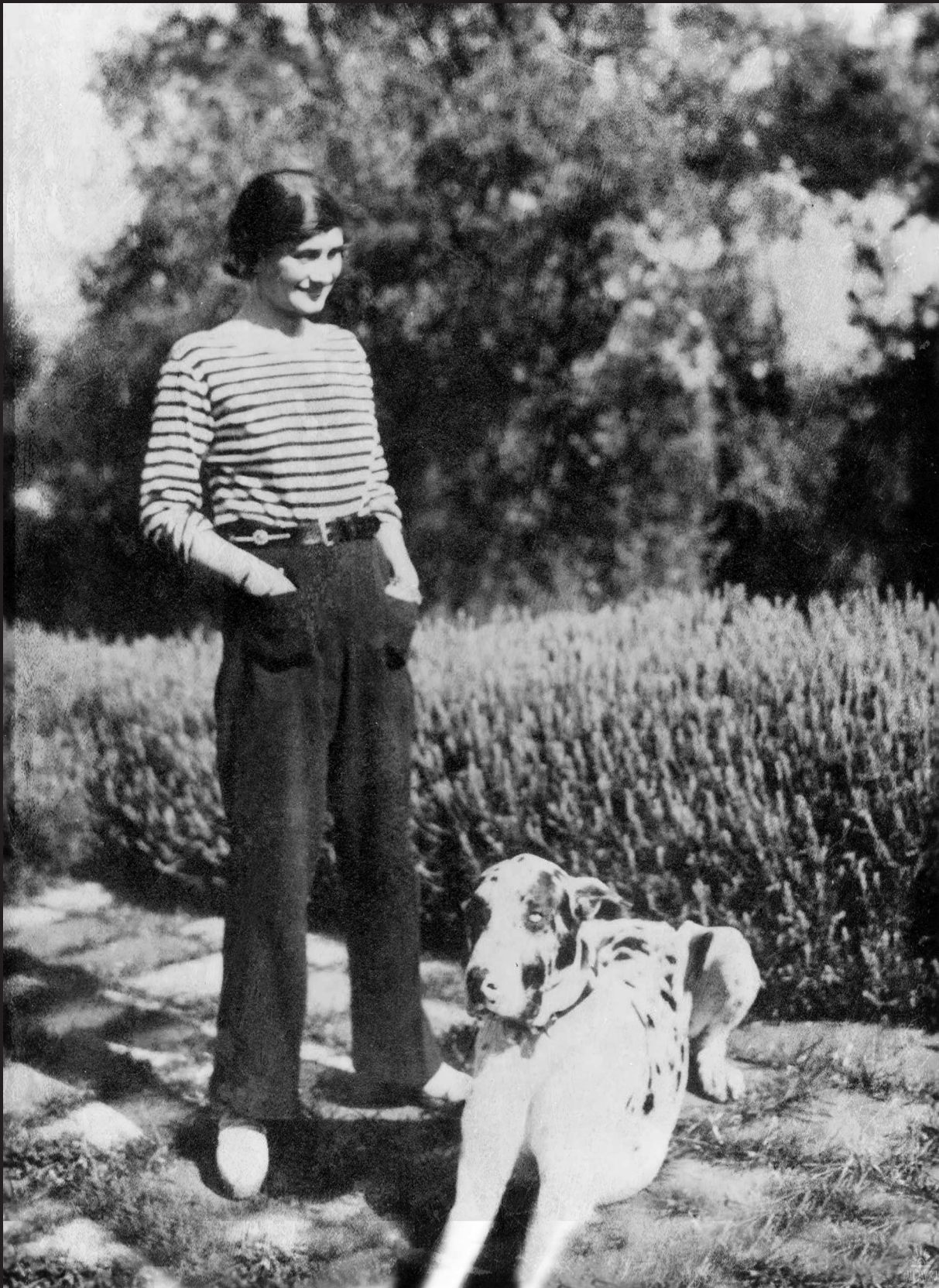
КОКО ШАНЕЛЬ В МАТРОССКОЙ КОФТЕ И БРЮКАХ, 1928