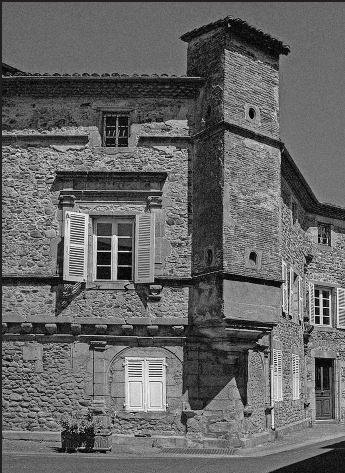
КУРПЬЕР, ДОСТОПРИМЕЧАТЕЛЬНОСТИ КОММУНЫ