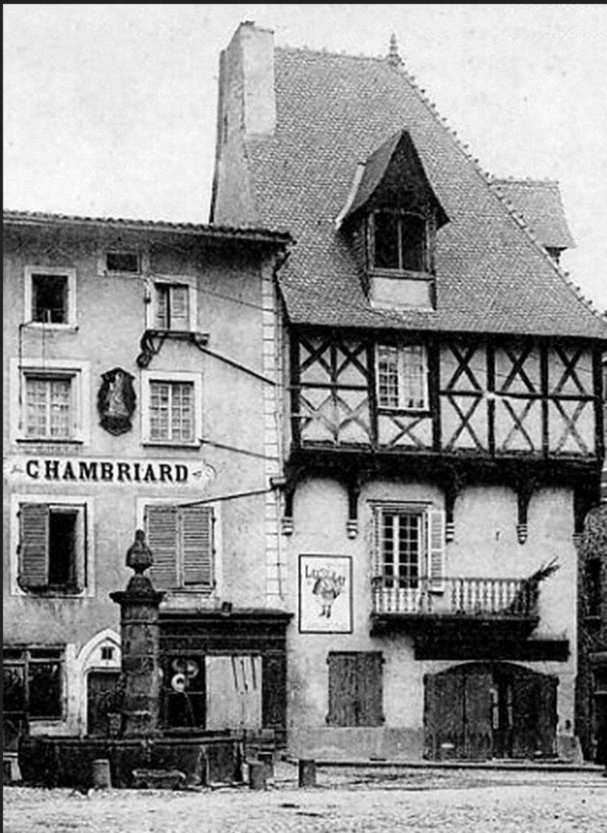
КУРПЬЕР, ДОСТОПРИМЕЧАТЕЛЬНОСТИ КОММУНЫ