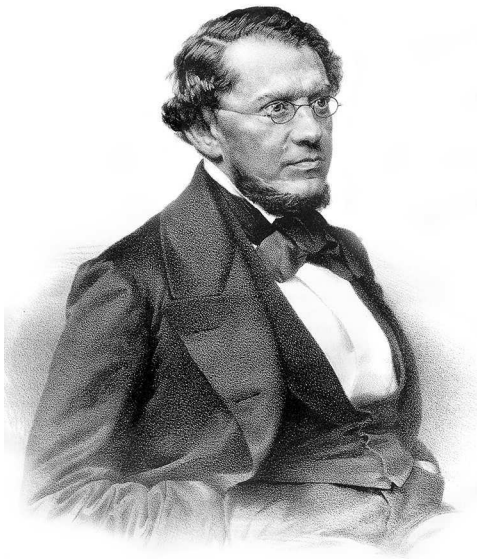
Константин Дмитриевич Кавелин. Гравюра из альбома « Портретная галерея русских деятелей ». 1864–1869 гг.

при котором состоял француз-губернер. Занятия проходили по утрам, не более трех часов в день, и затем Соловьев мог делать все что ему было угодно. Позавтракав, он отправлялся в Королевскую библиотеку, работал там до трех часов, потом возвращался домой, писал до обеда, то есть до шести часов, а вечером читал новые книги и журналы.