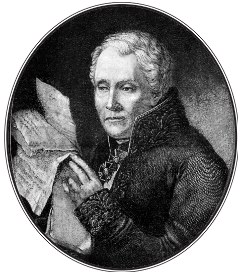
Михаил Трофимович Каченовский.

Гравюра из исторического журнала «Русская старина». 1889 г.