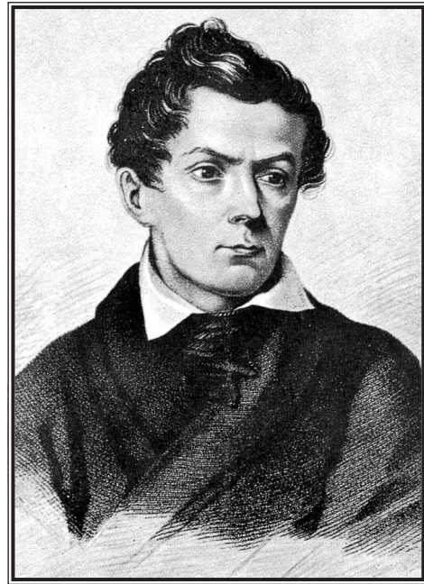
Николай Алексеевич Полевой (1796—1846)

Такая полнота уже сама по себе имеет значительную цену и во всяком случае делала бы труд Соловьева чрезвычайно полезным для историков, но по современным научным