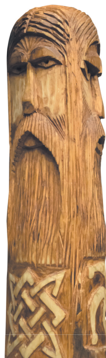
Главнейшее божество поморских славян — Триглав

Круглый год он стоял без всякого употребления, смотрел за ним внимательно один из четырех храмовых жрецов. Изображение Триглава в Волыни, сделанное из золота, вероятно, было не особенно больших размеров: при разорении