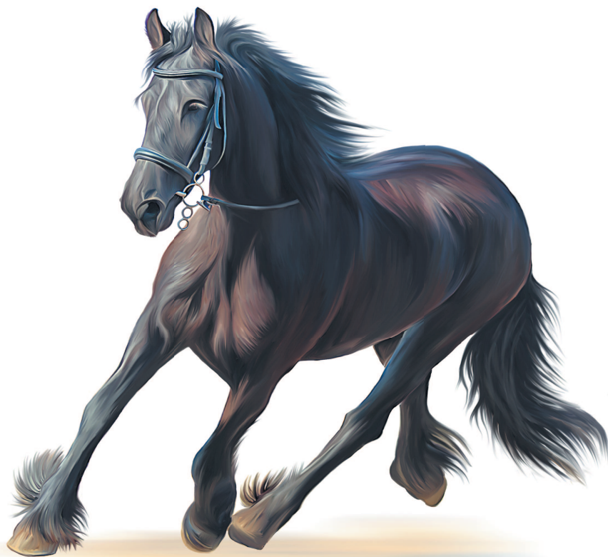
Вороной конь считался священным конем Триглава