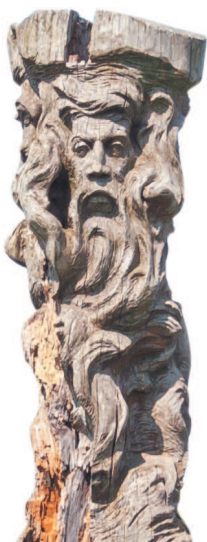
На острове Руяне Святovit являл собой идола о четырех головах: одна находилась спереди, другая сзади, а еще две смотрели по сторонам Деревянный идол Святovита на острове Рюген (фрагмент)