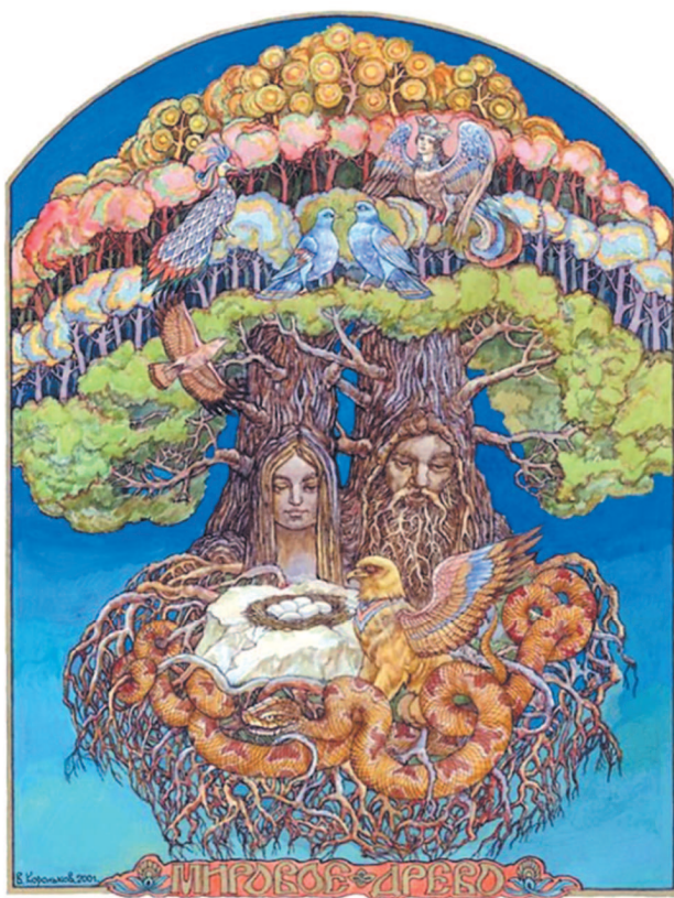
Крона Мирового древа достигает Ирия (рая), корни уходят в подземное царство. В представлении древних славян Мировое древо находилось на острове Буяне Мировое древо. В. А. Корольков

В давние времена человек полностью находился во власти природы и природных явлений. Например, успех в рыболовстве зависел от количества рыбы в водоемах, в охоте — от численности зверей в лесах, в собирательстве — от обилия растений на земле.