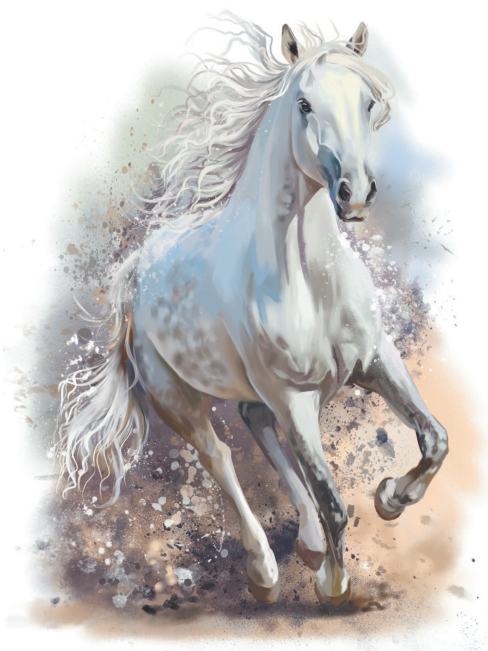
Белый конь при святилище Святовита почитался божественным

Святовиту (Свентовиту) посвящали жертвы и отдавали часть добычи