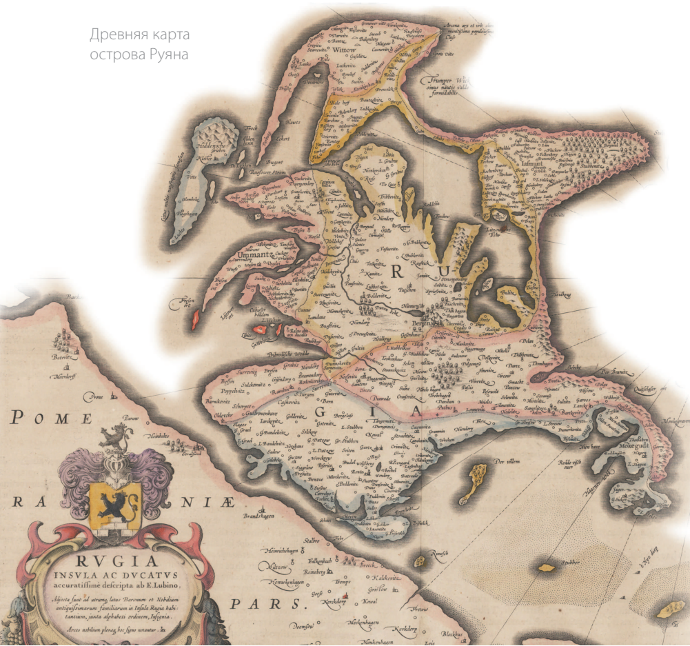
Древняя карта острова Руяна

храмы, таков был, например, истукан Подаги в Плуе (позже эта богиня превратилась в божество мужского рода).