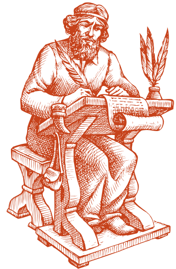
Сведения о мифологии славян можно почерпнуть из старинных летописей

Гораздо более ясные, подробные и обстоятельные известия имеем мы о природных святилищах, идолах и храмах балтийских славян. Природными святилищами были деревья и рощи, воды и горы. Леса, воды, также дома, по представлению людей, населены были духами