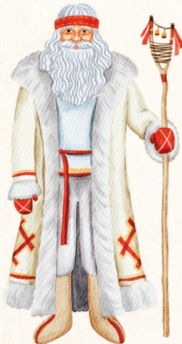
Мордовия. Якшамо Атя