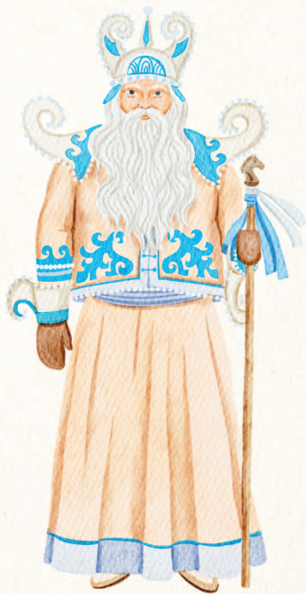
Тыва. Соок Ирей