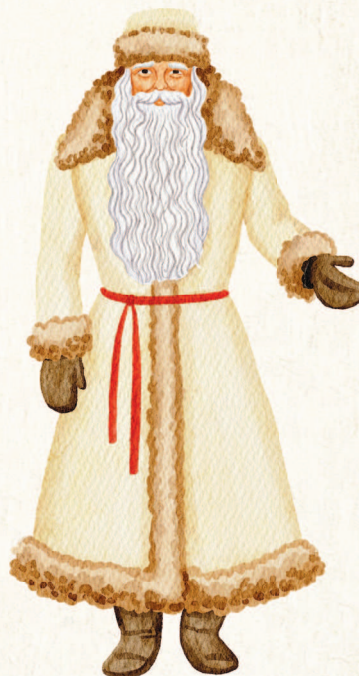
Чечня. Гор Дада