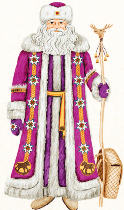
Удмуртия. Тол Бабай