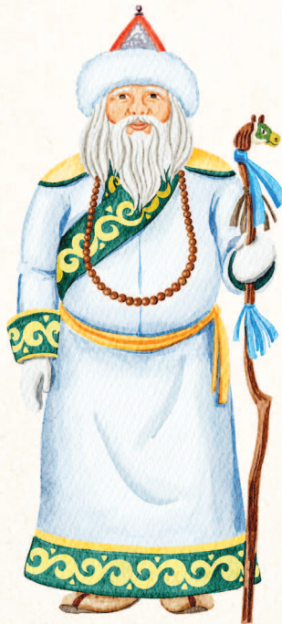
Бурятия. Сагаан Убугун