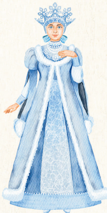
Архангельск. Матушка Зима