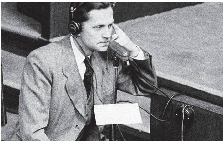
Вальтер Шелленберг в Нюрнберге

Еще одной отраслью тайной службы являются диверсии и саботаж. Эти действия направлены против определенных объектов, например против пунктов и баз снабжения и путей подвоза в тылу врага, крупных объектов военной промышленности, шахт и рудников, нефтепромыслов и нефтеперегонных заводов, а также мостов, аэродромов и т. п. В задачу политических диверсий входит также внедрение в политические группировки (партии) или движения в лагере противника и их разложение или переориентация. Сюда же относятся и использование оппозиционно настроенных политических меньшинств. Особой задачей диверсий считаются покушения на представителей военного и политического руководства. В принципе диверсии проводятся только во время войны, но планируются и усиленно готовятся уже в мирное время 1 .