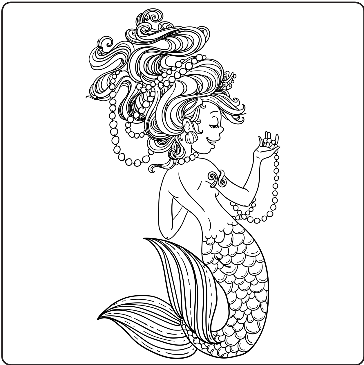
«Духи воды называются ундинами, или русалками». Из книги «Колдовская Навь – 2. Магия Стихий» (Каролина Инго)