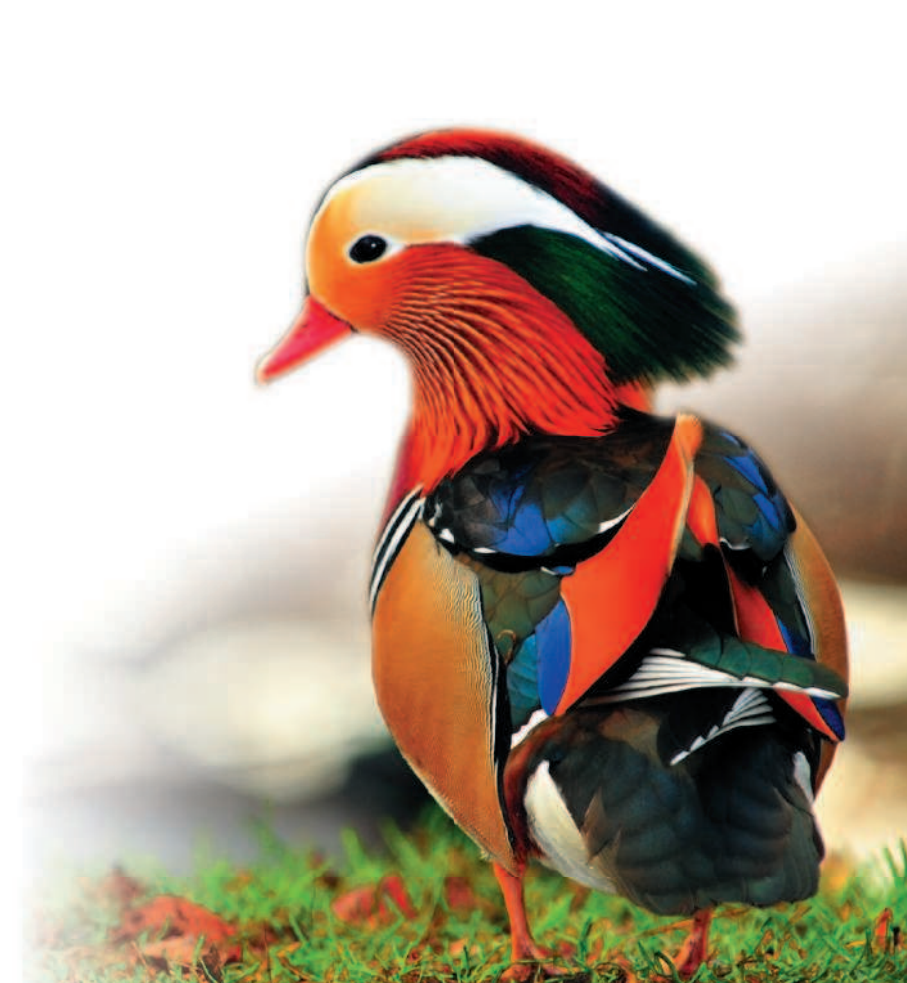
Этот удивительный красавец, самец утки-мандаринки ( Aix galericulata ), пока еще украшает мир дикой природы

Питер Скотт, возглавлявший Комиссию до 1978 года, предложил назвать такой список Красной книгой. Ведь красный цвет — это сигнал тревоги, опасности, особого внимания! Остановись, человек! Эти виды могут исчезнуть с лица земли навсегда!