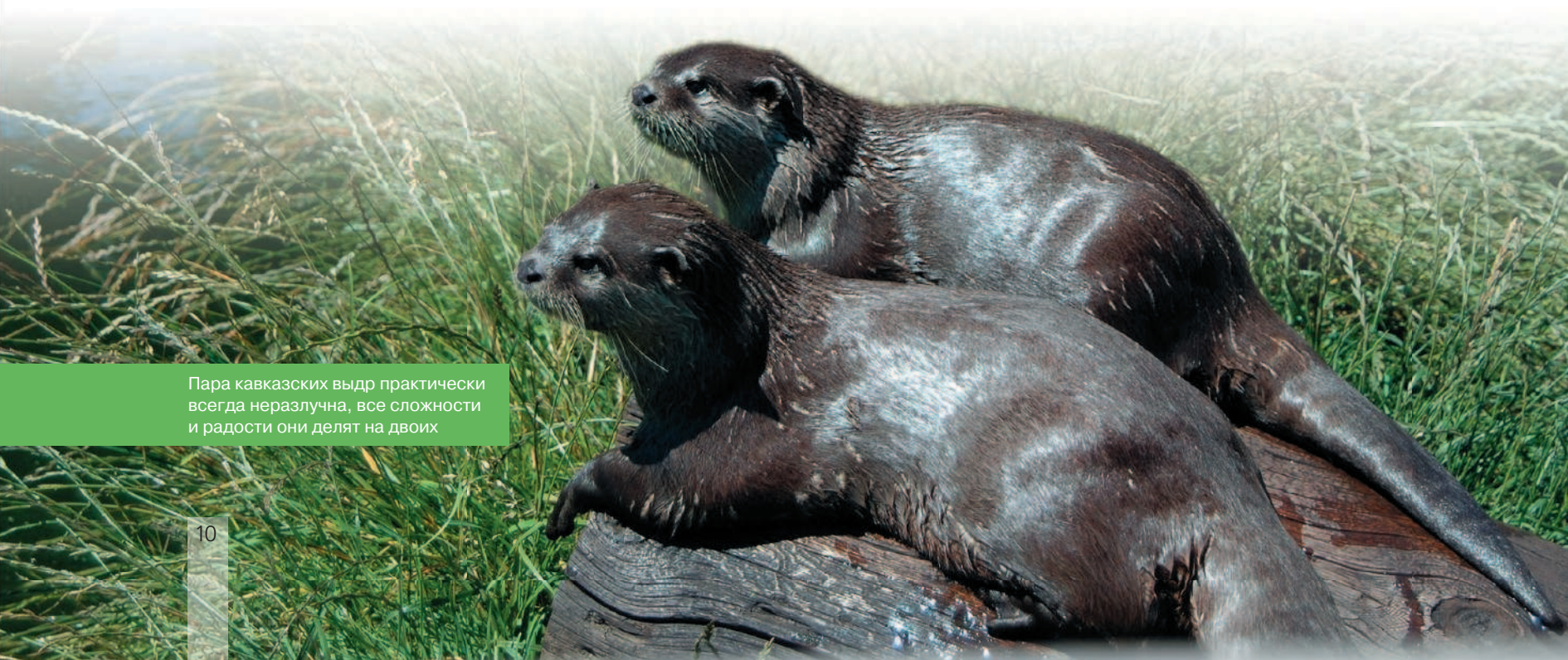
Пара кавказских выдр практически всегда неразлучна, все сложности и радости они делят на двоих

Итак, в 1963 году появилась первая Красная книга, Red Data Book, подготовленная МСОП. Два тома представляли собой сводку о 211 таксонах млекопитающих и 312 таксонах птиц. Первый выпуск походил на перекидной календарь и был не слишком объемным, каждая страница посвящалась отдельному виду. В течение 1966–1971 годов подготовлено второе издание,