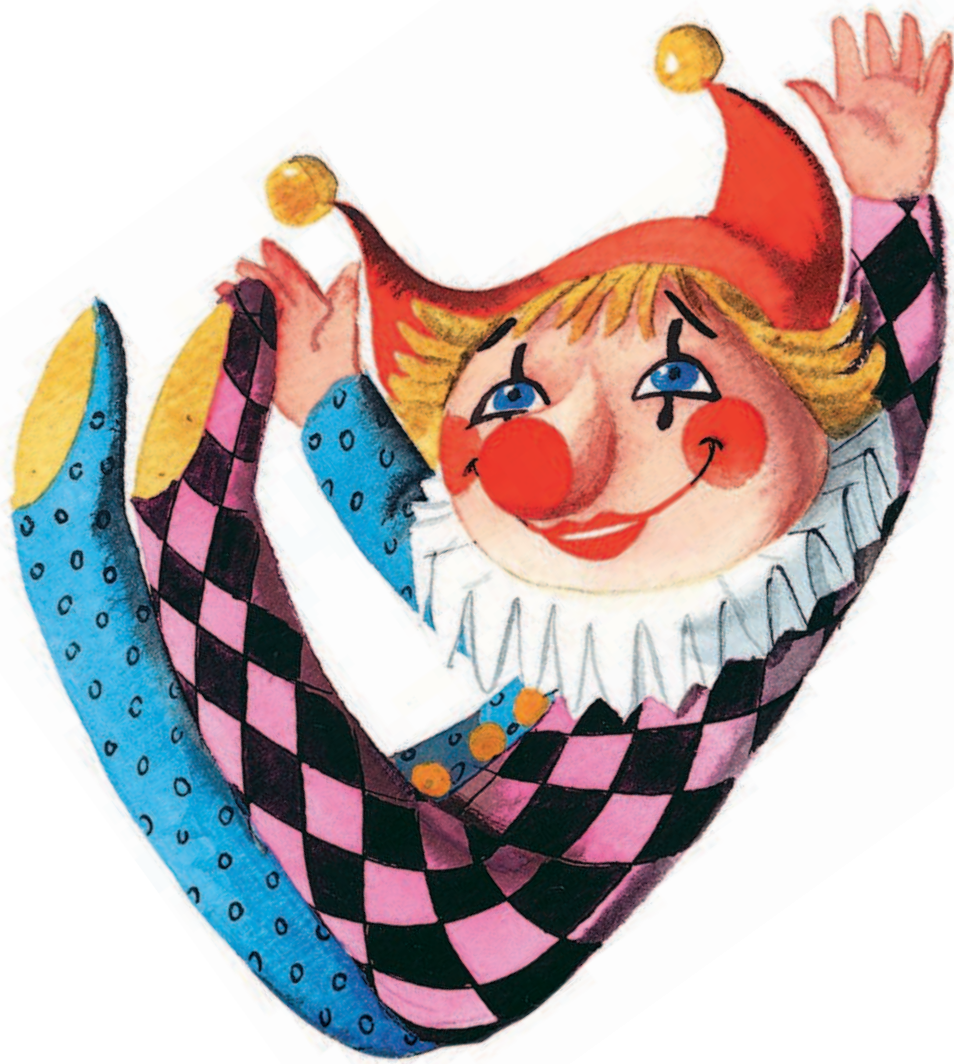
Рис. М. Рудаченко