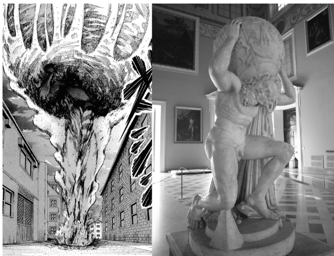
Слева: Эрен несет камень, глава 14. Справа: «Атлант Фарнезе», неизв. автор, римская репродукция эллинистического оригинала около 110 года. Мрамор. Национальный археологический музей Неаполя

Первое же бросающееся в глаза заимствование из древнегреческой мифологии — это образ Атланта, держащего на плечах шар земной. Именно так Эрен нес на себе огромный валун, которым надлежало завалить проломленные ворота. Атлант, или Атлас, — титан, которого олимпийские боги после победы в Титаномахии приговорили вечно держать на своих плечах небесный свод.