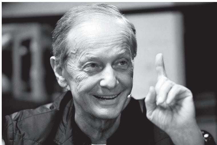
Михаил Задорнов предупреждает!

Потом он говорил, что сожалеет о некоторых своих репризах времён поздней перестройки. Задорнов сочинял из на кураже и подчас издевался над святынями, которые не стоило тревожить. Он умел признавать собственные ошибки: «Мы невольно приблизили распад Союза, многих людей настроили не только против власти, но и против страны. Это было помрачение умов. Захлестнул азарт. Мы ловили успех и не думали, что всё обрушится. Сейчас я писал бы по-другому...». Эти слова Михаил Николаевич повторял часто, на разные лады. Это сидело в нём. Вообще-то сатирик не обязан быть охранителем, должен кто-то и расшатывать больные зубы... Но он раскаивался — один из немногих среди властителей перестроечных дум. Задорнов умел не только веселиться, но и грустить, и сочувствовать тем, кто трагически пострадал от «шоковой терапии» девяностых. При Ельцине он легко мог стать придворным острословом с гарантированным ангажементом и высоким положением «у корми-