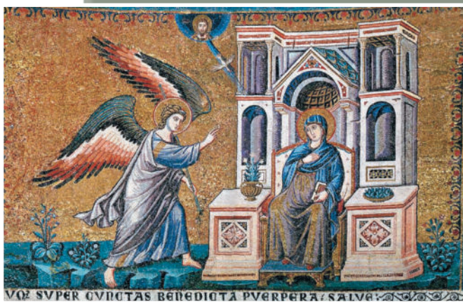
ПЬЕТРО КАВАЛЛИНИ Благовещение. 1291

В озрождение (Ренессанс) — одна из самых ярких эпох в истории мирового искусства. Это было время нового осмысления природы и человека, время великих имен и универсальных гениев, время грандиозных перемен в истории европейских народов, оставившее глубокий след в европейской культуре. Границы Ренессанса условны, так как для каждого европейского государства они разные. Эпоха Возрождения пришла на смену темному Средневековью, полностью подчиненному церковным канонам, и предшествовала последующему Просвещению и Новому времени. Приблизительно этот период охватывает XIV–XVI вв. в Италии, XV–XVI вв. в странах, расположенных к северу от Альп. В это время в Европе старый, средневековый, уклад жизни постепенно разрушался, в условиях высокого уровня городской цивилизации начался кризис феодализма и процесс зарождения капиталистических отношений. Происходило складывание наций и создание крупных национальных государств, появилась новая форма политического строя — абсолютная монархия. Духовный мир человека тоже менялся. Великие географические открытия и гениальное изобре-