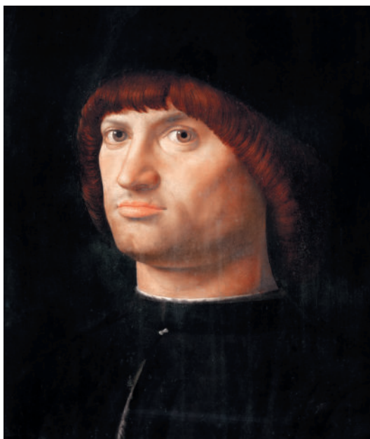
АНТОНЕЛЛО ДА МЕССИНА Кондотьер («Портрет неизвестного») 1475

Настоящее название картины неизвестно. Также неизвестен заказчик картины и имя самого человека, которого изобразил художник. Название картины дано позднее. Выражение лица портретируемого создает впечатление о властном человеке, скорее всего, военном — кондотьере. Так и появилось название картины.