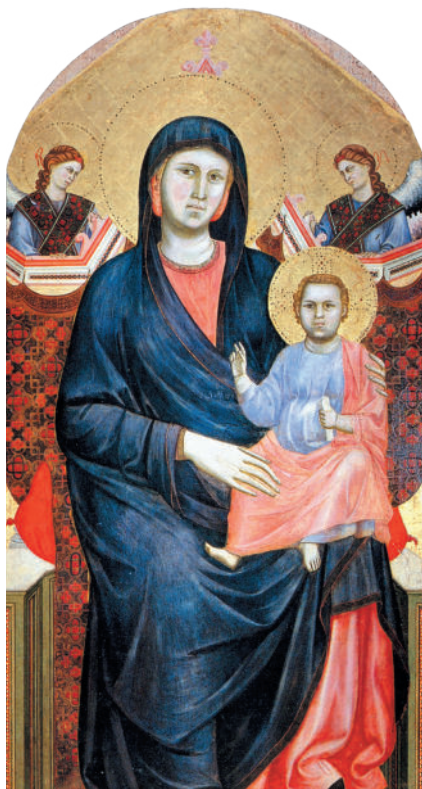
Джотто ди Бондоне Мадонна с младенцем и двумя ангелами. 1295–1300

Историки делят Ренессанс в живописи на четыре этапа: Проторенессанс, Раннее, Высокое и Позднее Возрождение.