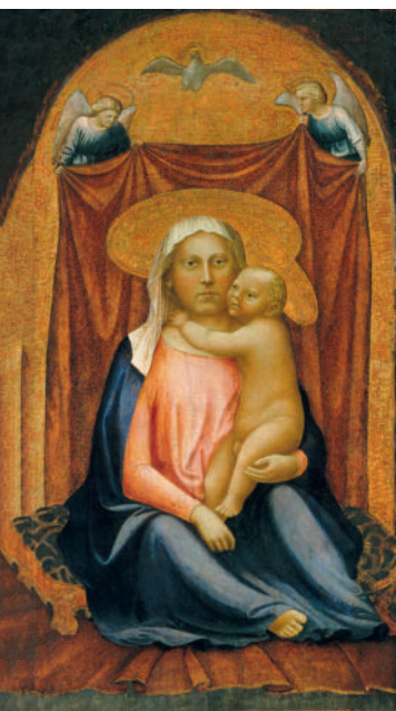
МАЗАЧЧО Мадонна с младенцем. 1424–1425

В озрождение (Ренессанс) — одна из самых ярких эпох в истории мирового искусства. Это было время нового осмысления природы и человека, время великих имен и универсальных гениев, время грандиозных перемен в истории европейских народов, оставившее глубокий след в европейской культуре. Границы Ренессанса условны, так как для каждого европейского государства они разные. Эпоха Возрождения пришла на смену темному Средневековью, полностью подчиненному церковным канонам, и предшествовала последующему Просвещению и Новому времени. Приблизительно этот период охватывает XIV–XVI вв. в Италии, XV–XVI вв. в странах, расположенных к северу от Альп. В это время в Европе старый, средневековый, уклад жизни постепенно разрушался, в условиях высокого уровня городской цивилизации начался кризис феодализма и процесс зарождения капиталистических отношений. Происходило складывание наций и создание крупных национальных государств, появилась новая форма политического строя — абсолютная монархия. Духовный мир человека тоже менялся. Великие географические открытия и гениальное изобре-