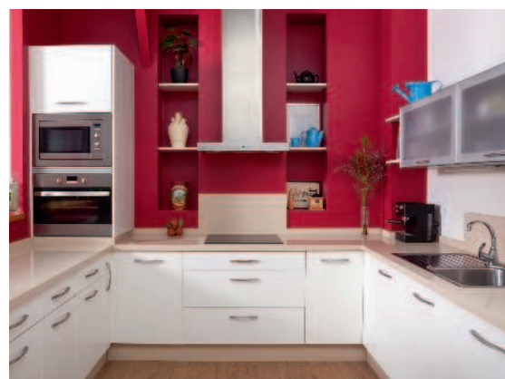
▲ В интерьере оттенки красного можно использовать для того, чтобы сделать его более собранным и создать яркий контраст, например между отделкой и мебелью