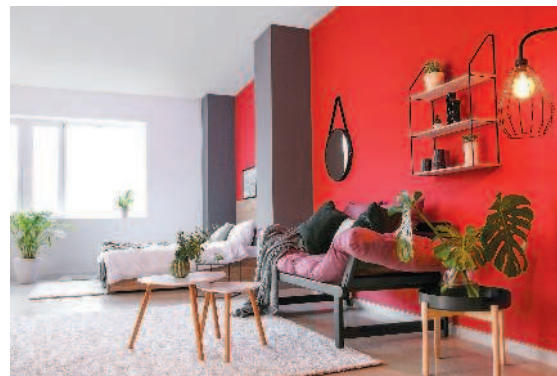
▲ Обилие красного позволительно только для очень просторных комнат

Этот цвет нравится увлекающимся и творческим людям. Любовь к нему нередко свидетельствует о хорошо развитой интуиции. Оранжевый — цвет солнца и неподдельной радости. Его оттенки усиливают аппетит и повышают работоспособность. При оформлении спален малышей лучше избегать этого цвета из-за его будоражащего действия.