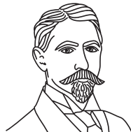
И. А. Бунин