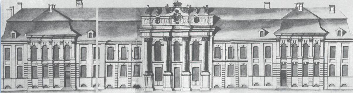
Проект петровского дворца, созданный Георгом Маттарнови. 1710-е гг.