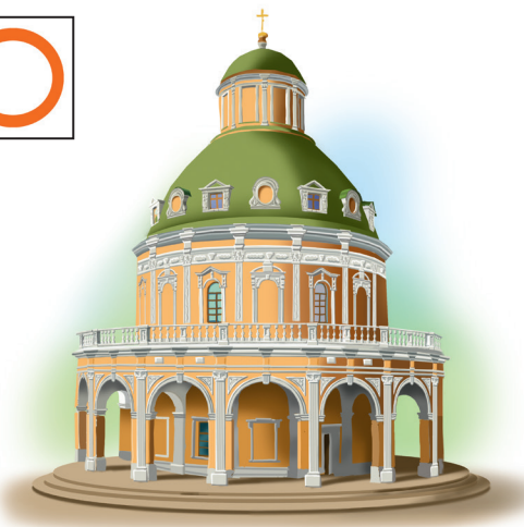
Храм Рождества Богородицы в селе Подмоклово имеет форму ротонды, в его основании — круг (символ вечности)

Для русской архитектуры характерны храмы с завершением в форме шатра, примером может служить церковь Вознесения Христова в Коломенском.