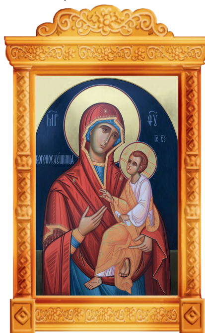
Пресвятая Богородица, икона в киоте

Иисус Христос — Сын Божий, Спаситель мира.