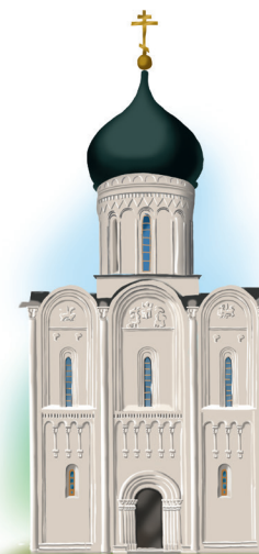
В основании храма Покрова на Нерли лежит четырёхугольник — символ полноты мира, собранного в Церкви Христовой

Храмы бывают разные, их форма имеет особое символическое значение. У одних храмов в основании лежит крест. Он символизирует Крест, на котором был распят