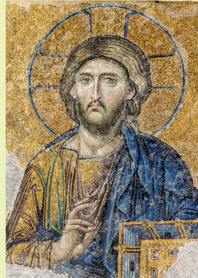
Мозаика Христос Вседержитель (Пантократор) из собора Святой Софии в Стамбуле, XII в.

О ГОСПОДЕ ИИСУСЕ ХРИСТЕ рассказывает самая известная в мире Книга — Библия. В Его честь построено множество храмов. Именно там — в храме — мы можем обратиться ко Христу, «поговорить» с ним. Такое общение с Богом происходит через молитву и церковные Таинства. Учение Христа называют христианством, а людей, которые следуют заветам Христа, — христианами.