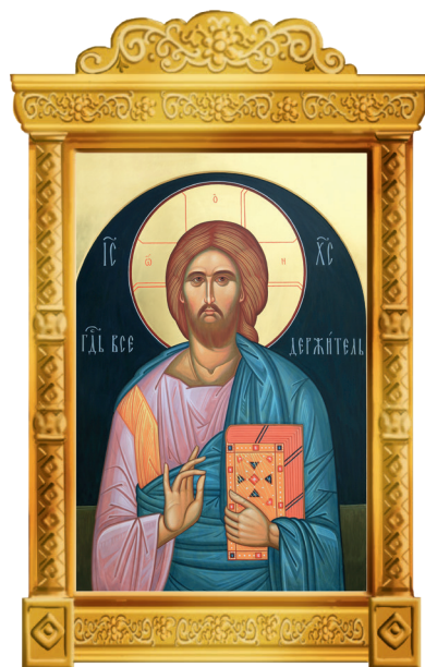
Господь Вседержитель, икона в киоте

Иисус Христос — Сын Божий, Спаситель мира.