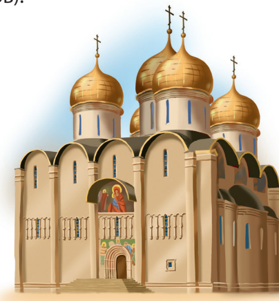
В основании Успенского собора Московского Кремля лежит крест

Храмы бывают разные, их форма имеет особое символическое значение. У одних храмов в основании лежит крест. Он символизирует Крест, на котором был распят