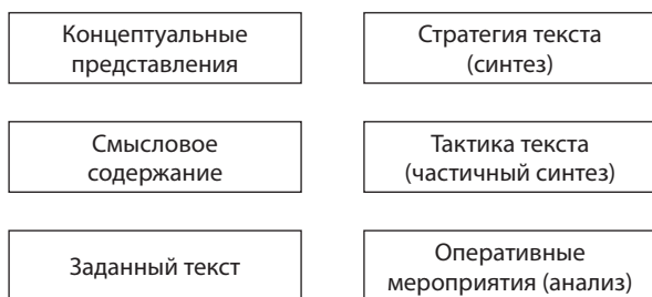
Рис. 1. Схема, описывающая понятие естественного языка

С учетом описанных трех групп задач естественный язык представляется следующей схемой (рис. 1).