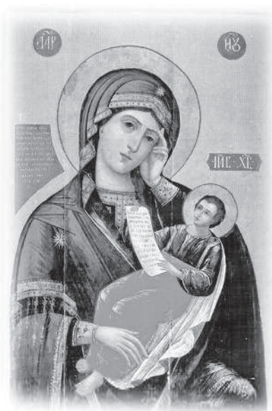
Икона Божией Матери «Утоли моя печали». Из трапезной церкви Сергия Радонежского Троице-Сергиевой лавры

— И все равно лучше верить. Хоть как-то, хоть с пятого на десятое. Хоть по субботам и воскресеньям. Потому что люди настолько