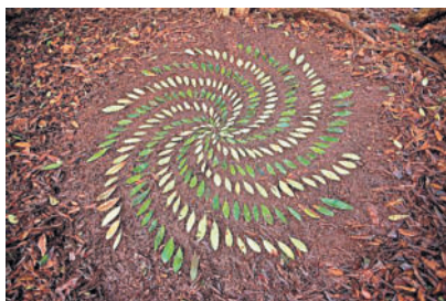
Работы Джеймса Бранта, Йоркшир, Великобритания

Ты можешь создать объект ленд-арта из любых материалов, которые найдёшь на прогулке — веток, листьев, камней.