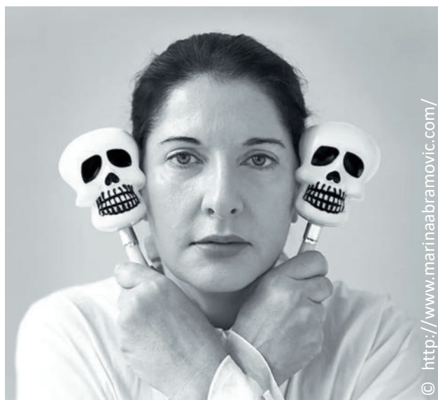
Марина Абрамович, род. 1946