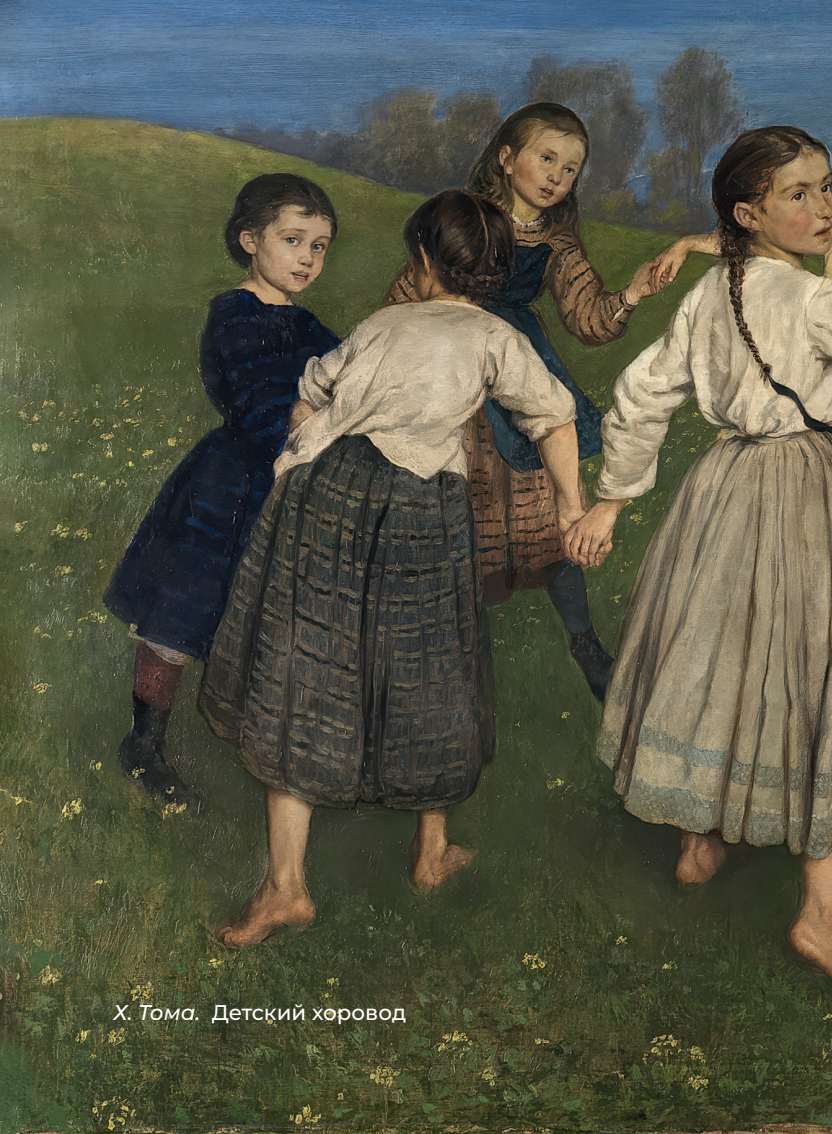
Х. Тома. Детский хоровод