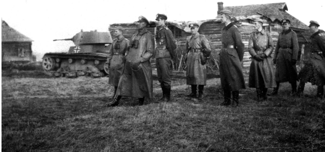
Группа немецких офицеров наблюдает за действиями подчинённых на учениях с использованием трофейных советских танков, на заднем плане снимка трофейный легкий танк Т-26 обр. 1939 года (СР).

входили два Т-34 и три Т-26. Спустя полгода, 1 июня 1943 года количество трофейных машин возросло до восьми, а на 1 сентября 1943 года уменьшилось до четырёх (два Т-70 и два Т-26). Один танк Т-70 числится в 369-й пехотной дивизии в конце 1944 года. 1 октября 1943 года рота трофейных танков 16-й Армии (Beute-Pz.Кр. АОК 16), была придана 184-му дивизиону штурмовых орудий с семью танками Т-34 и тремя Т-26. Несколько Т-34 в составе 277-го дивизиона штурмовых орудий и два трофейных танка Т-34 с 85-мм орудиями в составе 252-й пехотной дивизией (252 Infantry Division) использовались в ходе боев в Восточной Пруссии.