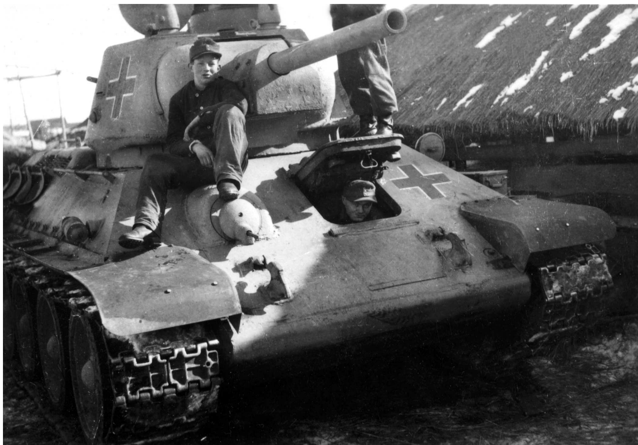
Трофейный средний танк Т-34 из неустановленного подразделения. Район Витебска, 1944 год (СР).

ле СС «Тольц» (SS-Junkerschule «Tolz») в Баварии. Разумеется, отсутствие данного типа советских танков в сводках ОКХ не говорит о том, что в немецких подразделениях их не было.