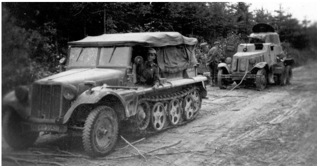
Немецкий полугусеничный тягач SdKfz. 10 готовится к буксированию захваченного советского броневедомо­мобиля БА-10 (СР).

льоне (502 sPzAbt), вспоминает о боях осени 1943 под Невелем (Псковская область): «Был еще один неприятный инцидент с двумя трофейными русскими танками Т-34. Два «немецких» танка прошли через посты охранения, а вернулись в вечерних сумерках. Наши противотанковые подразделения, которые не имели понятия, что в танках немецкие экипажи, тут же подбили обе машины. Нанесенный на них краской «балочный» крест был неразличим в темноте. С тех пор никого из наших людей невозможно было заставить сесть в трофейный танк». Упоминания аналогичных случаев можно встретить и в мемуарах других немецких танкистов.