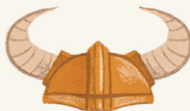
Шлем из оперы «Кольцо нибелунга»

Начнем с названия: кто такой викинг? Объяснить и перевести скандинавское слово víkingr можно по-разному: «человек из залива ( vik )», «преодолевающий определенное расстояние по морю ( vika )», «далеко ушедший от дома ( víkja — двигаться, перемещаться)» или же просто «морской воин». Викингами называли себя сами участники морских набегов, а вслед за ними и те, кто от этих набегов страдал. А еще, так как в Великобританию разбойники приплывали с севера, в древних английских королевствах их величали норманнами, северными людьми. Викинги прибывали со Скандинавского полуострова и окрестных земель, например из Дании. И наверное, главный миф заключается в том, что каждый житель тех земель был