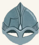
Полумаска из Гьёрмундбю

Просто сравните: шлем из оперы «Кольцо нибелунга», который придумал художник-костюмер Карл Эмиль Деплер, и реальный шлем с полумаской, найденный в норвежском Гьёрмундбю.