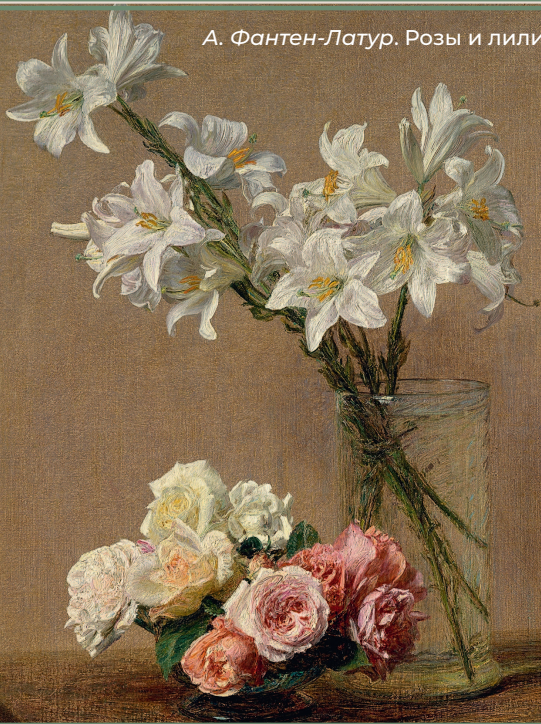
А. Фантен-Латур. Розы и лилии