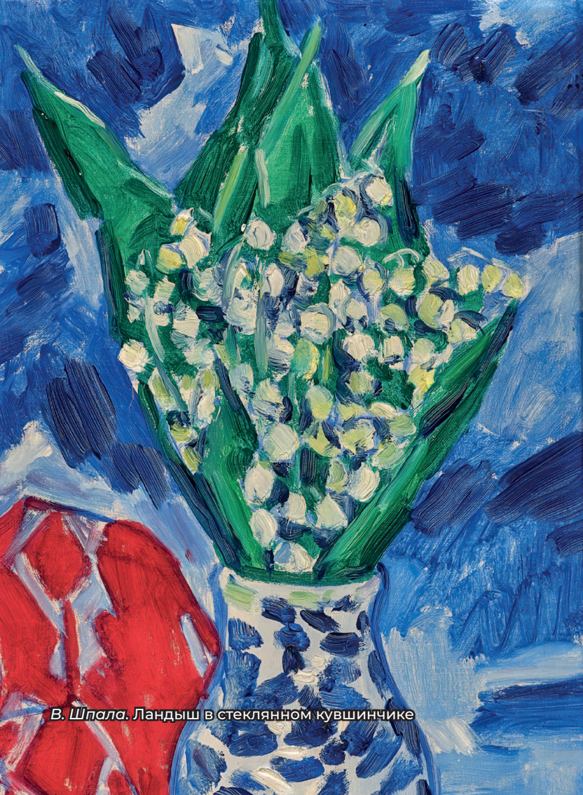
В. Шпала. Ландыш в стеклянном кувшинчике