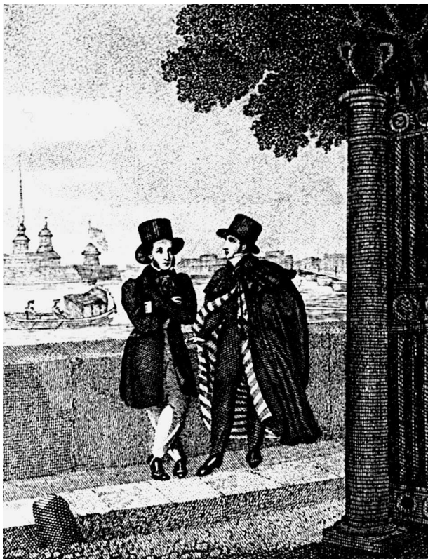
«Евгений Онегин». Нотбек А. В. Грав. Гейтман Е. И. Иллюстрация. 1828 г.