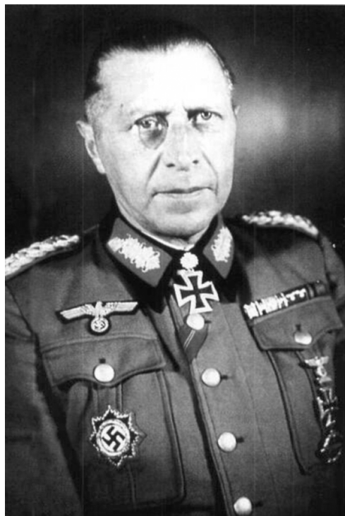
Командир LVI танкового корпуса генерал артиллерии Гельмут Вейдлинг.