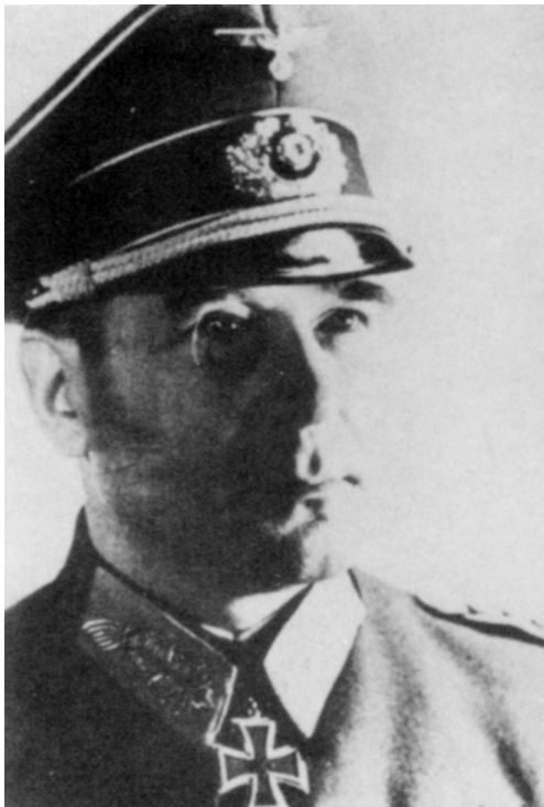
Генерал пехоты Ханс Кребс, последний начальник Генерального штаба германской армии.

41 гг. по проекту Шпеера и по своему основному назначению они были убежищами для населения в период налетов. Считалось, что вероятность прямого попадания бомбы в башню ниже, чем в подземное убежище. Каждая башня по плану вмещала 18 тыс. человек. В Берлине было построено три таких гигантских сооружения. Это были Flakturm I в районе Зоопарка, Flakturm II во Фридрихсхайне (на востоке города) и Flakturm III в Гумбольтхайне (на севере города).