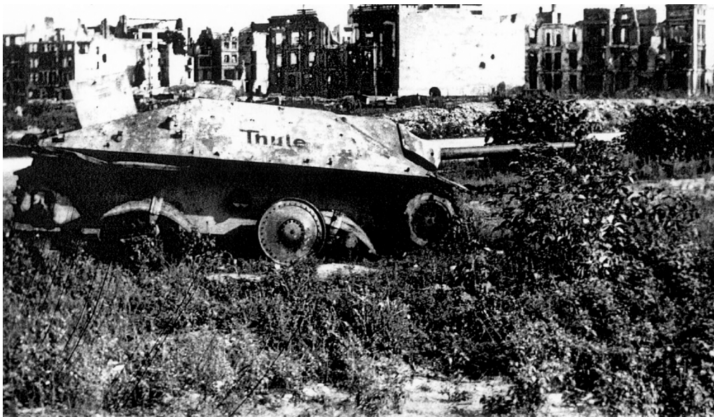
САУ «Хетцер» на окраинах Берлина. Помимо «фаустников» в городе советские войска встретили немало вполне традиционных противотанковых средств.

одного метра в затопляемом секторе. Исключение составляют тоннели (не станции), проходящие под Ландвер-каналом в центре города. Подробнее об этом будет рассказано ниже.