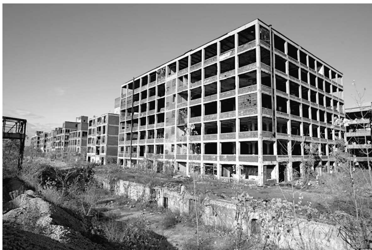
Автомобильный завод Packard. Некогда он был визитной карточкой Детройта