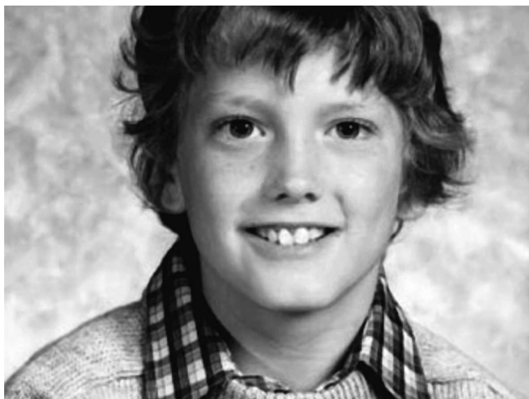
Еминем в детстве