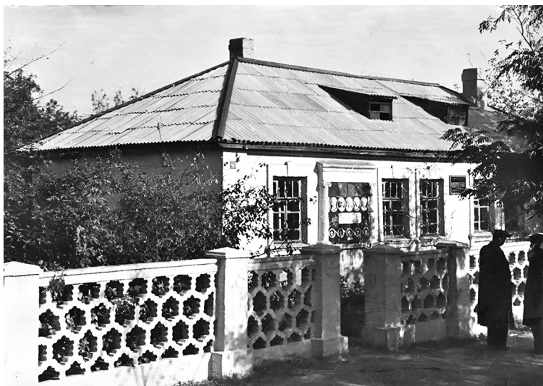
Один из домов г. Краснодона, в котором собирался штаб подпольной организации «Молодая гвардия». 1956 год

Потом он вызывал из строя по одному для принятия клятвы. Когда Олег назвал мою фамилию, меня ещё больше охватило волнение. Я сделал два шага вперёд, повернулся