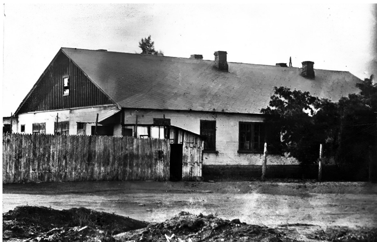
Здание полиции, где члены подпольной комсомольской организации «Молодая гвардия» подвергались истязаниям. 1940-е годы

16 января нас, 6 человек, бросили в подвал. Там уже было 30 человек. В эту ночь увели на расстрел 9 человек. Остальные с минуты на минуту ждали такой же участи.