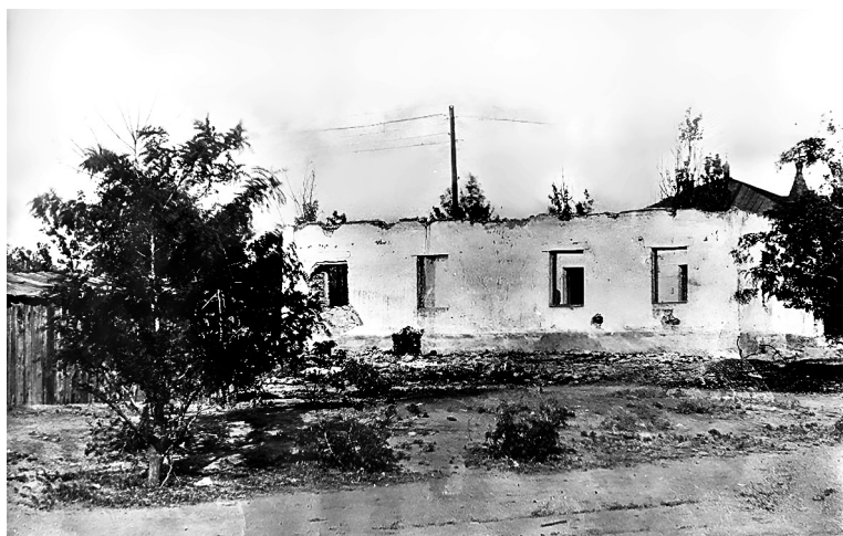
Разрушенное здание нацистской биржи труда, уничтоженное молодогвардейцами со всеми документами. 1940-е годы

В ночь с 5 на 6 декабря 1942 года отважная тройка молодогвардейцев — Люба Шевцова, Сергей Тюленин и Виктор Лукьянченко — проводит трудную операцию по поджогу не-