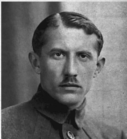
Евгений Михайлович Коновалец (1891 (1892?) – 1938) – видный деятель украинского националистического движения 1920 – 1938 годов

В дивизии, где я служил, вместе с нами сражались поляки, австрийцы,