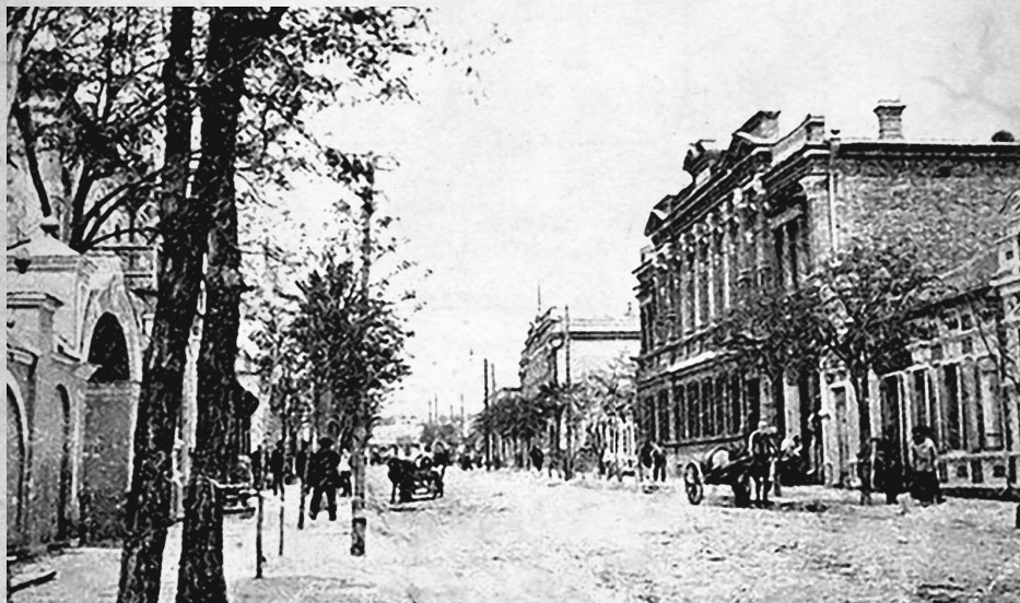
Мелитополь. Начало XX века

Поначалу жизнь в городе мало в чем изменилась, и все текло по заведенному. Однако, как только подошли к концу запасы продовольствия,