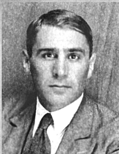
Павел Судоплатов. Фотография с загранпаспорта-прикрытия. Финляндия. 1935 год