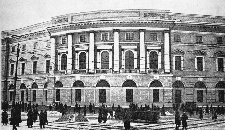
Государственная публичная библиотека им. Салтыкова-Щедрина. Ленинград. Начало тридцатых годов

Я ехал за границу как «племянник» Лебеда, якобы для помощи в его работе. Моя жена была переведена в Иностранный отдел НКВД для того, чтобы через нее я мог поддерживать связь с Центром. Она должна была выступать в роли студентки из Женевы, что позволило ей время от времени встречаться с агентами в Западной Европе. С этой целью она прошла специальный курс.