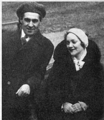
Павел Судоплатов с женой. 1935 год