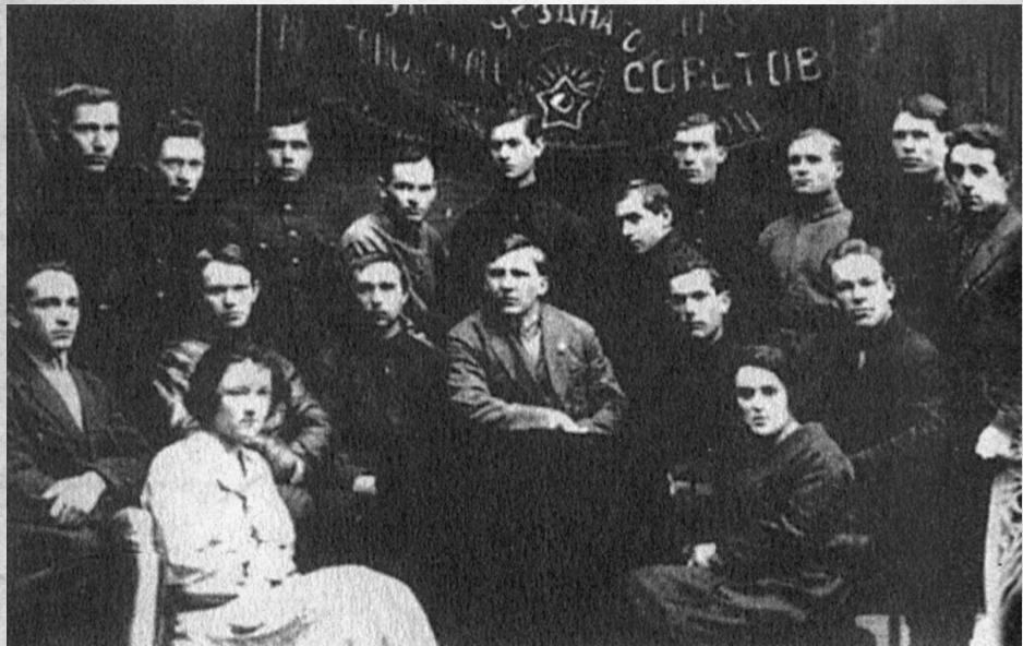
Сотрудники окружного отдела ГПУ города Мелитополя. В верхнем ряду — Павел Судоплатов. 1925 год

В течение последних трех лет пребывания в Мелитополе я был младшим оперативным работником в окружном отделе ГПУ и от-