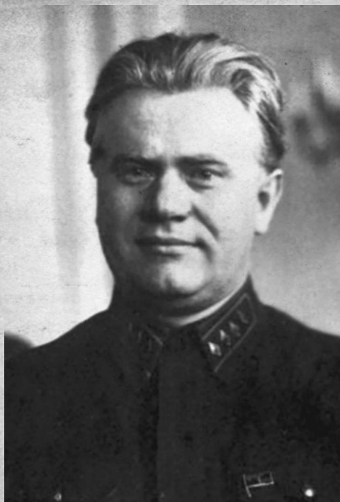
Всеволод Аполлонович Балицкий (1892–1937) – деятель ВЧК-ОГПУ-НКВД, комиссар государственной безопасности 1 ранга (26.11.1935).