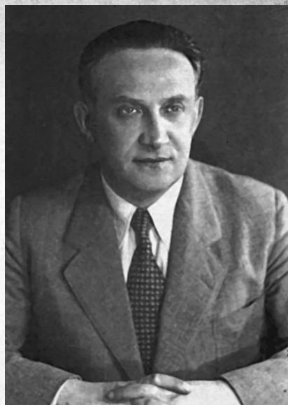
Сергей Михайлович Шпигельглас (1897–1941) — сотрудник советской разведки, майор государственной безопасности. В 1938 году — врид (временно исполняющий должность) начальника ИНО