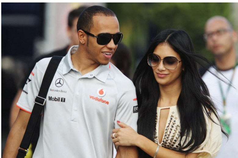
ЛЬЮИС И НИКОЛЬ ШЕРЗИНГЕР В ТУРЦИИ-2010. ЗДЕСЬ ВПЕРВЫЕ В УШАХ ЛЬЮИСА БЫЛИ ЗАМЕЧЕНЫ УКРАШЕНИЯ. И ОН ВЫИГРАЛ ЭТУ ГОНКУ