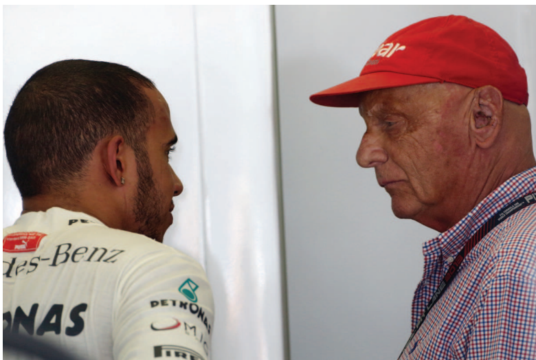
ЛЬЮИС ХЭМИЛТОН И НИКИ ЛАУДА. АВСТРИЙСКИЙ ЧЕМПИОН ПРИВЕЛ ЛЬЮИСА В «МЕРСЕДЕС»