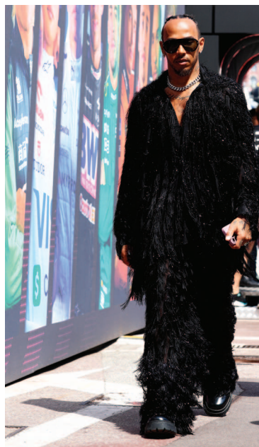
ТРАНСФОРМАЦИЯ ЛЬЮИСА 2007-2024