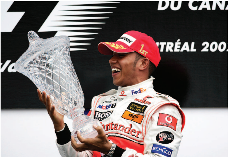
КАНАДА-2007: ПЕРВАЯ ПОБЕДА В «ФОРМУЛЕ-1»