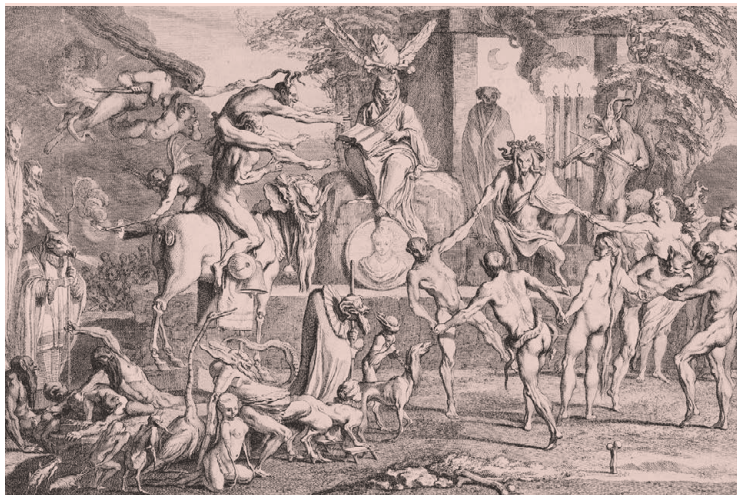
Изображение шабаша на гравюре Клода Жилло, 1700–1720 гг.

на английский П. Дж. Максвелл-Стюарта (2007), выполненный по франкфуртскому изданию 1588 г. *