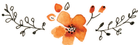
Рисунок внутри венка

Я постоянно использую венки, чтобы рисунок выглядел интереснее, а его композиция — гармоничнее. Они могут использоваться для того, чтобы выделить то, что вы считаете наиболее важным в рисунке.